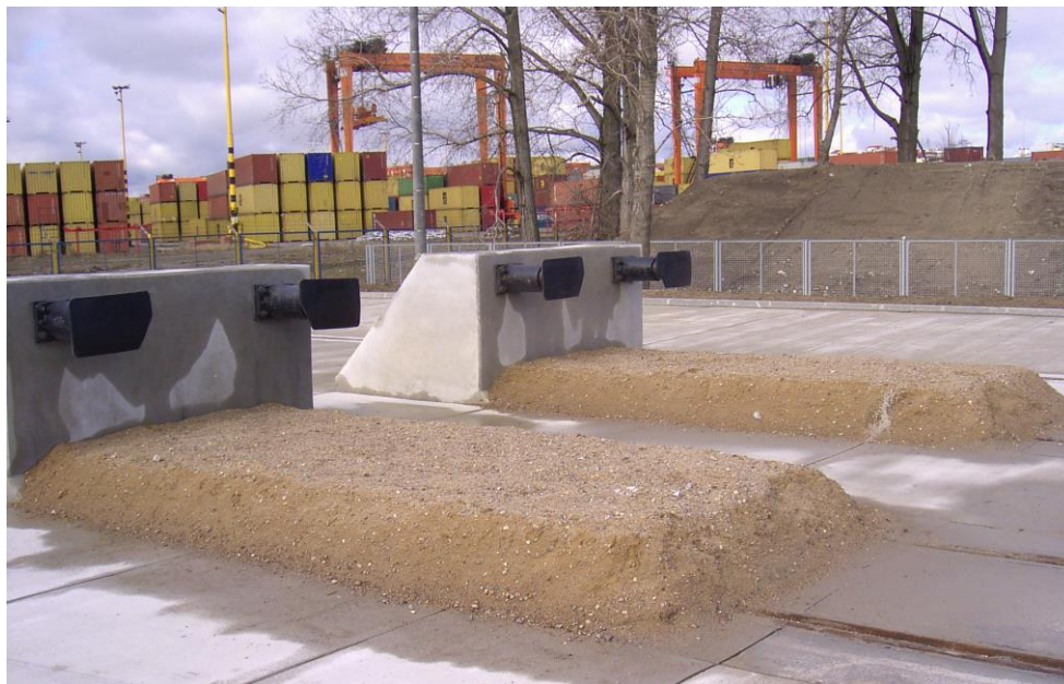
Rys.6. Kozioł oporowy o konstrukcji żelbetowej z zasypką piaskową

Na większości bocznic kolejowych mamy do czynienia z bardzo małymi prędkościami przetaczania składów wagonowych wynoszącymi zazwyczaj 5-10 km/h. Należy zatem sprawdzić, czy zaprojektowana grubość i długość zasypki pozwoli na zatrzymanie wagonów o znanej masie i prędkości maksymalnej.