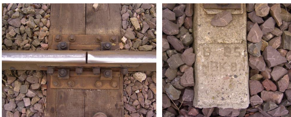
Rys.1. Widok połączenia szyn łubkami (z lewej) i podkładu strunobetonowego INBK 8N wyprodukowanego w 1985 r. (z prawej)

W czasie oględzin torów kolejowych należy wykonać dokumentację fotograficzną, która pozwoli na porównanie stanu istniejącego z projektowanym. Szczególną uwagę należy zwrócić na elementy konstrukcyjne nawierzchni kolejowej, np. połączenia elementów nawierzchni, nietypowe rozwiązania (nawierzchnia bezpodsypkowa, nawierzchnia na wagach), wady konstrukcyjne i wykonawcze, rok produkcji, itp.