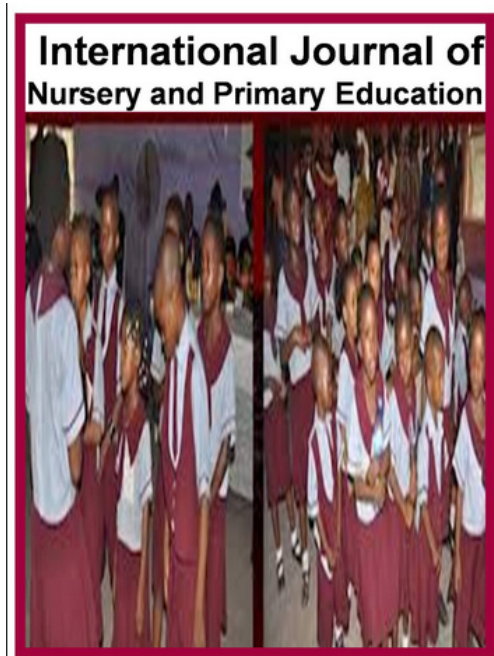
Ryc. 3. Okładka czasopisma International Journal of Nursery and Primary Education

Zamieszczone na stronie GSRJ okładki czasopism wyglądają nieprofesjonalnie, są złej jakości (np. International Journal of Nursery and Primary Education ), niekiedy z błędami (np. w tytule Global Journal of medical, Physical and Health Education „medical” pisane małą literą).