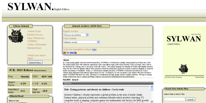
Ryc. 6. Witryna internetowa fałszywego czasopisma Sylwan. English Edition