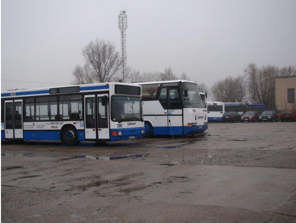
Rys. 3 Autobusy wykorzystywane do badań mocy akustycznej