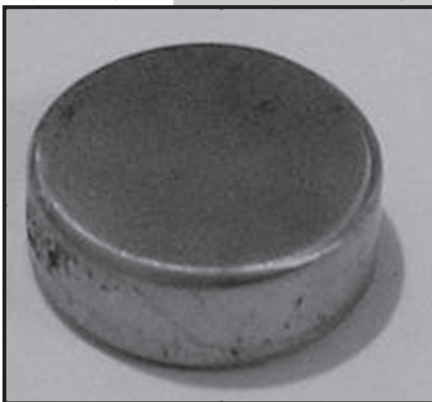
RYS.1 Widok próbki wyciętej z implantu FIG.1 The view of an implant sample

The silver ions have ability to join the bacteria surface. Low density of silver ions Ag^+ influence the protons through the bacteria surface, which results in total destruction of the cell. Antibacterial activity of silver remains in proportion with the density of silver ions Ag^+ in the environment [3].