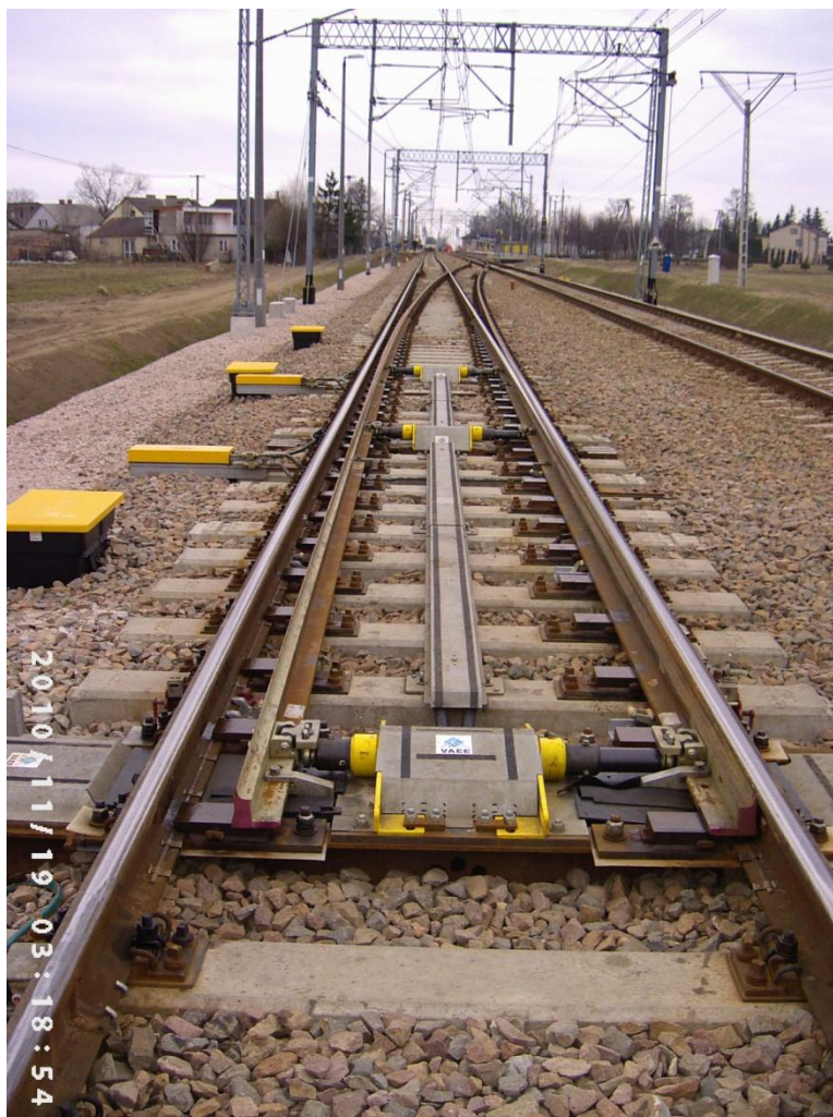
Fot.2. Widok ogólny rozjazdu Nr 1 na stacji G (Rz 60E1 1200 1:18,5)

Na fotografiach Nr 1 i 2 przedstawiono dwa przykładowe ujęcia na etapie oddania rozjazdu kolejowego do eksploatacji. Zdjęcie Nr 2 obrazuje ogólny widok rozjazdu Nr 1 na stacji G, który z dalej widocznym rozjazdem Nr 2 tworzy połączenie dwóch torów równoległych. Natomiast na fotografii Nr 1 pokazano przyleganie iglicy łukowej do opornicy prostej w rozjeździe Nr 1.