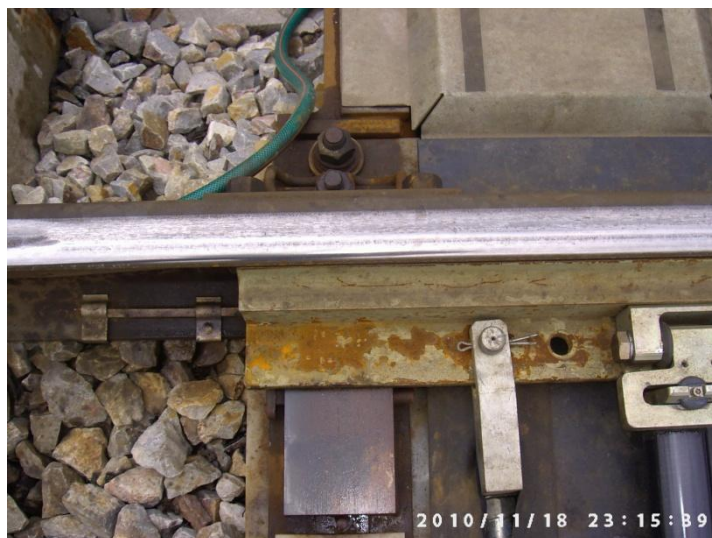
Fot.1. Widok opornicy prostej i iglicy łukowej (przyleganie iglicy do opornicy)

W praktyce diagnostyka obrazowa powinna być stosowana od momentu ułożenia nowego rozjazdu, nawet wtedy, gdy nie wykryto żadnych wad. Należy wówczas wykonać kilka zdjęć ogólnych, np. iglicy i opornicy, krzyżownicy, dzioba krzyżownicy, urządzenia przeciwpełznego oraz widok rozjazdu w stosunku do przyległych torów i innych rozjazdów.