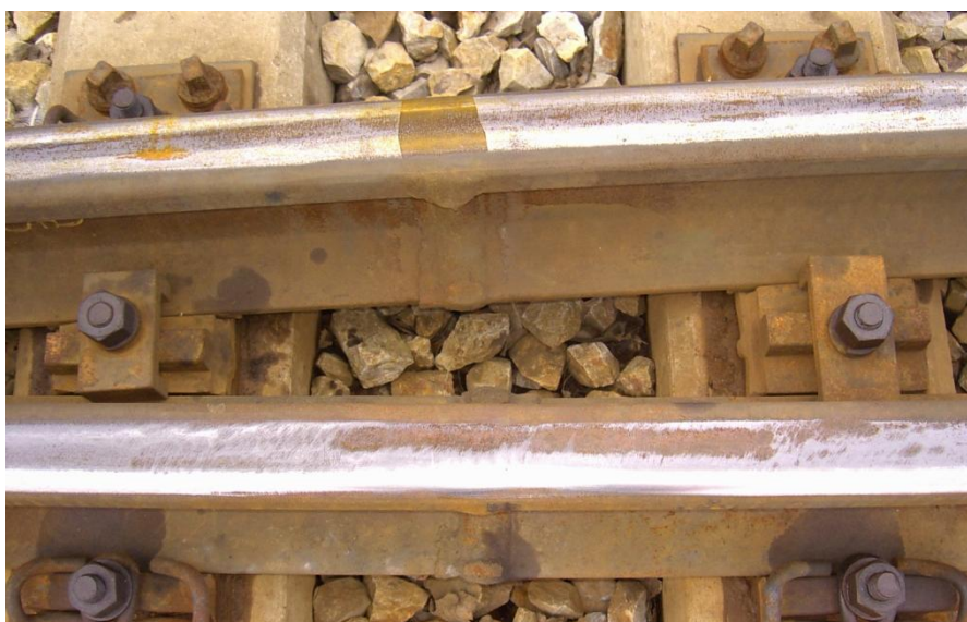
Fot.5. Połączenie spawane – zbyt głębokie szlifowanie szyny