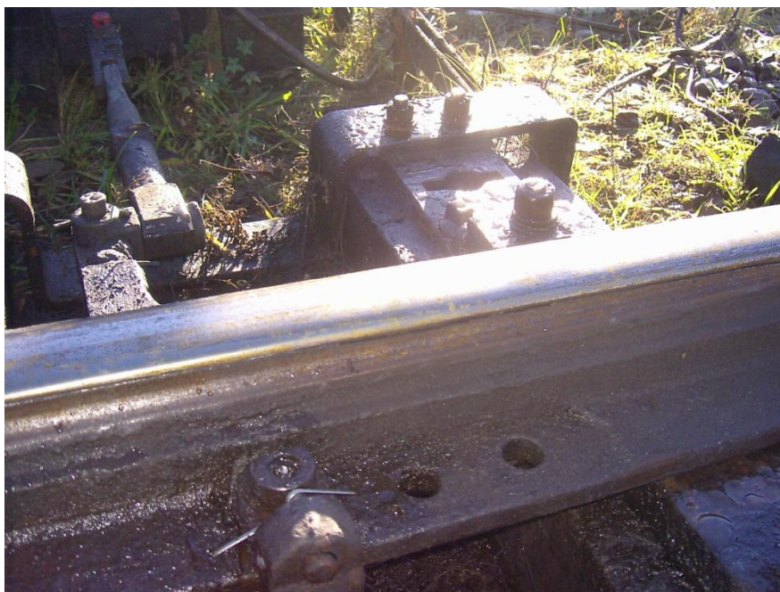
Fot.3. Iglica łukowa i opornica prosta – kod wady 1241224

Jako przykład zastosowania typologii wad w diagnostyce obrazowej posłuży fotografia Nr 3. Na zdjęciu widoczna jest iglica łukowa, przylegająca dobrze do opornicy prostej. W iglicy łukowej (prawej) stwierdzono wyszczerbienie w odległości 30 cm od początku iglicy na długości 16 cm oraz zużycie boczne iglicy w tym miejscu równe jest 3 mm. Jednak w dalszej części zużycie iglicy wynosi 8 mm, co kwalifikuje ją do wymiany.