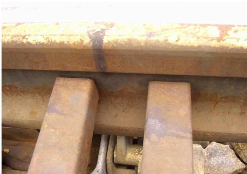
Fot.7. Brak przyleganie iglicy do opórek