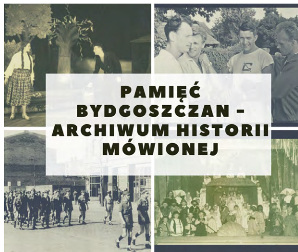
Paulina Gawrych, CC BY 4.0