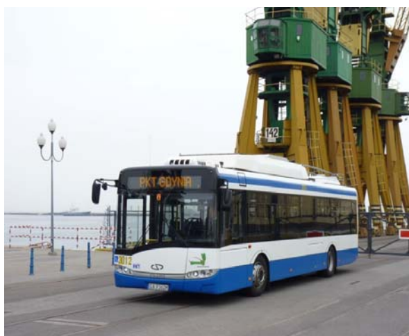
Fot. 1. Trolejbus Solaris Trollino 12 / Medcom wyposażony w baterie nikielowo-kadmowe firmy SAFT.

Bazując na przedstawionych powyżej argumentach podjęto decyzję o zakupie trolejbusów wyposażonych w pomocniczy napęd akumulatorowy. Z dostępnych na rynku technologii wybrano baterie nikielowo-kadmowe. Podstawowym czynnikiem stojącym u podstaw tej decyzji była żywotność ogniwy wykonanych w tej technologii potwierdzona doświadczeniami eksploatacyjnymi innych użytkowników. Zaletą baterii nikielowo-kadmowych jest także ich duża przeciążalność prądowa, mająca kluczowe znaczenie w przypadku napędów trakcyjnych.