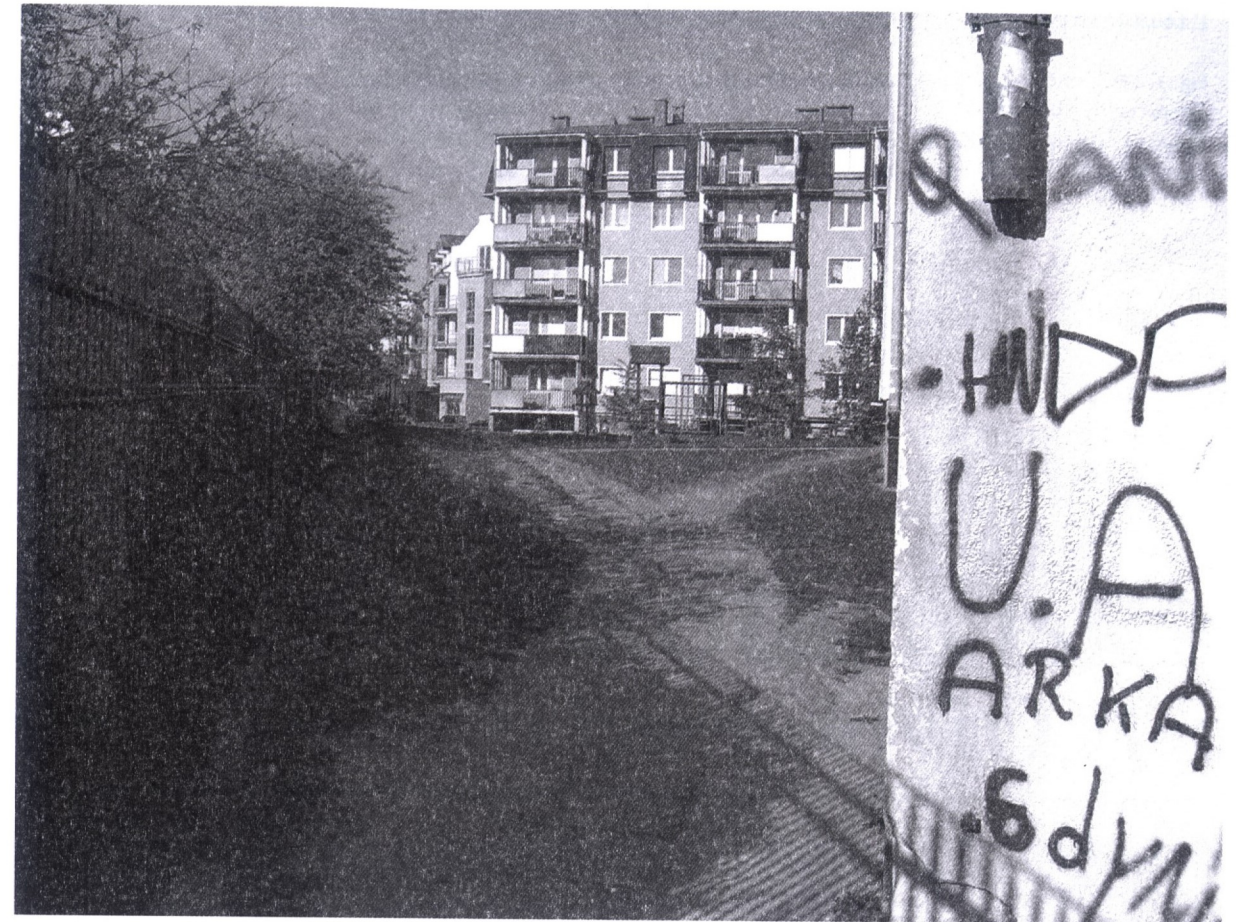
Fot. 3. Gdynia Zachód. Zdezintegrowane, gniazdowe struktury mieszkaniowe osiedli deweloperskich

struktury mieszkaniowej. Takie procesowe podejście mogłoby sprawić, że Gdynia Zachód zaistniałaby w systemie struktur przestrzennych Trójmiasta jako wielofunkcyjny, stopniowo osiągnięty dojrzałość park miast, w którym tereny zagospodarowane przez urbanistyczne i rekreacyjne inwestycje harmonijnie współistnieją z obszarami chronionego krajobrazu.