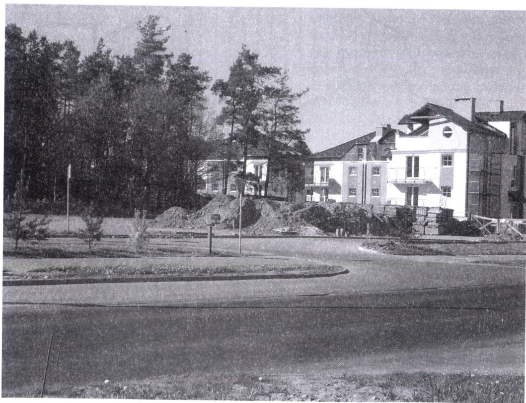
Fot. 2. Gdynia Zachód. Presja urbanizacyjna na tereny zielone, którym zagraża komunikacja motorowa oraz masowa penetracja piesza i rowerowa