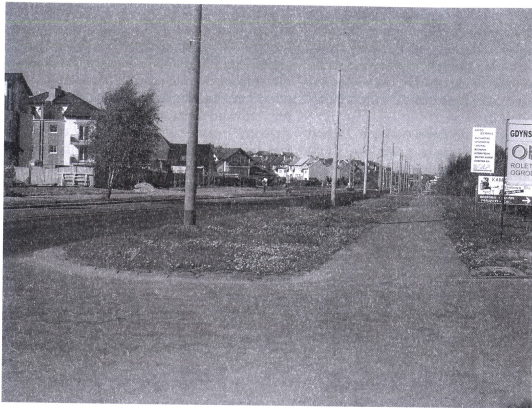
Fot. 1. Gdynia Zachód. Nieprzyjazny, sztywny i labiryntowy, astrukturalny podmiejski krajobraz