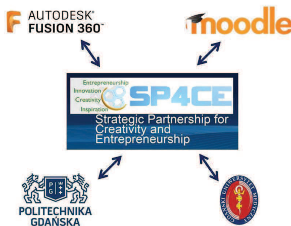
Ryc. 1. Schemat współpracy PG – GUMed – SP4CE

Za sprawą nawiązanego porozumienia powstały tzw. „pokoje nauki” (LR) (ang. Learning Room) na platformie Moodle dedykowanej do pracy nad poszczególnymi projektami grupowymi. Idea współpracy została przedstawiona na poniższym schemacie (ryc. 1).