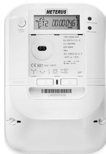
Rys. 1. Inteligentny licznik energii elektrycznej firmy EVB Energy Solutions GmbH

Technologia Smart Grid obejmuje także nowoczesne urządzenia pomiarowe instalowane bezpośrednio u odbiorcy energii – tzw. inteligentne liczniki energii (ang. Smart Meter). Umożliwiają one między innymi zdalny odczyt informacji o poborze energii i parametrach sieci u odbiorcy, pozwalają wykrywać nielegalny pobór energii, ułatwiają lokalizację uszkodzeń i usprawniają zarządzanie mocą przyłączeniową. Przykładowy licznik tego typu pokazano na rys. 1.