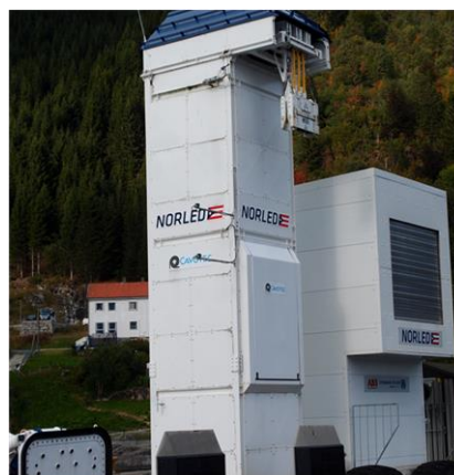
Rys. 3. Dwa systemy ładowania nabrzeżnego promu „Ampere”

Czas dostępny na ładowanie akumulatorów, podczas postoju promu to zaledwie 10 minut. Poziom niezbędnej mocy elektrycznej znacznie przekracza możliwości sieci energetycznej w wioskach Lavik i Oppedal, dlatego zainstalowano buforowe akumulatory w obu portach. Mogą być one ładowane z sieci w sposób ciągły z mocą 250 kW zapewniając następnie szybkie przekazanie energii do akumulatorów promu. Podczas postoju w nocy, prom ma do dyspozycji siedem godzin na naładowanie akumulatorów.