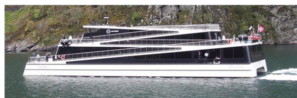
Rys. 5. Hybrydowy prom pasażerski „Vision of the Fjords”

Obie jednostki są nowocześnie zaprojektowanymi katamaranami, o długości 40 m i szerokości 15 m, wykonanymi z lekkich materiałów kompozytowych z włókna węglowego. Kształt promu został zainspirowany szlakiem na stromym zboczu góry (rys. 5), którego odzwierciedleniem są ścieżki spacerowe na wyższe pokłady (pasażerowie mogą okrążyć około 80% zewnętrznej części statku i podziwiać przepiękne widoki fiordów). Konstrukcja promu umożliwia podziwianie atrakcji turystycznych niezależnie od pogody – na najwyższym pokładzie lub w przestronnych i komfortowych wnętrzach inspirowanych stylem nordyckim z dużymi panoramicznymi oknami. Każdy z promów może przewozić 400 turystów na dwóch pokładach.