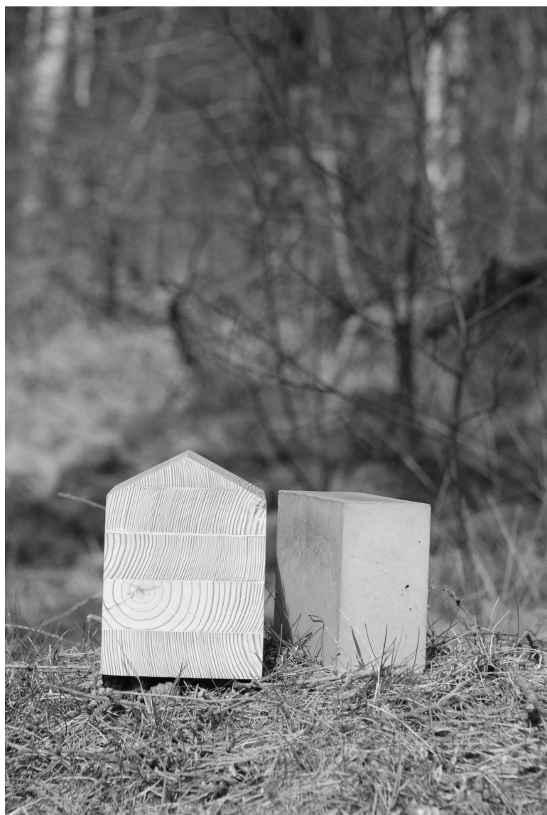
Ilustracja 1. Ideowa rzeźba architektoniczna prezentująca dom jednorodzinny oparty na dwóch pozornie wykluczających się koncepcjach estetycznych

mieszkańcy tego domu znają jako pierwowzór domu z dzieciństwa. Pomimo oczywistych niedoskonałości osiedli budynków mieszkaniowych wielorodzinnych, fakt zamieszkiwania ich w okresie, kiedy buduje się w młodym człowieku poczucie przynależności, oznacza sentymentalną konieczność przywołania śladu tej formy we własnym domu. Koncepcja architektoniczna tego obiektu bazuje na próbie połączenia obu estetyk i zaczerpnięciu z nich cech wykorzystanych następnie w wykreowanej przestrzeni zamieszkiwania, z którą, w efekcie, utożsamiają się mieszkańcy.