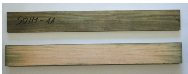
Rys. 1. Próbkę impregnowanego drewna sosnowego (nr próbki SOIM-11). Na górze pokazano powierzchnię zewnętrzną, a niżej – powierzchnię wewnętrzną po przecięciu

Właściwości materiałowe dla prostopadłego kierunku prędkości skrawania względem włókien drewna, wiążkość R_{\perp} (energii właściwą niezbędną do wytworzenia pęknięcia o powierzchni jednostkowej w trakcie skrawania – ang. fracture toughness ) oraz naprężenia tnące w strefie ścinania \tau_{Y\perp} , które wykorzystano do prognozowania wartości mocy skrawania (tabl. I), określono według metodologii opracowanej przez Orłowskiego i opisanej w pracach [11, 13] z wykorzystaniem testów skrawalnościowych na pilarsce ramowej PRW15M z eliptyczną trajektorią ostrzy oraz hybrydowym, dynamicznie wyrównoważonym układem napędowym [15].