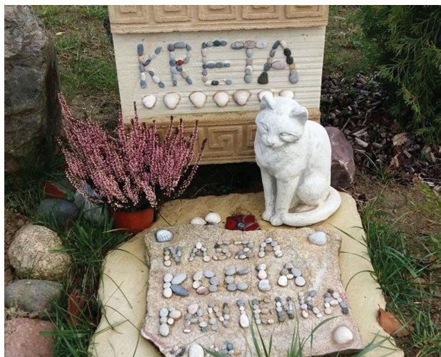
Il. 4. Mochle, grzewisko Brzozowa Przystań – nietypowy nagrobek

Fig. 4. Mochle, pet cemetery Brzozowa Przystań – unconventional gravestone (source: http://brzozowaprzystan.pl/galeria/_cmentarz-dla-zwierzat-mochle-kolo-bydgoszczy-7/ [accessed: 7.08.2017])