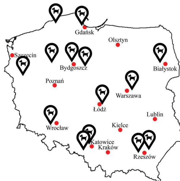
Il. 1. Rozmieszczenie grzebowisk dla zwierząt w Polsce (oprac. A. Myślińska)