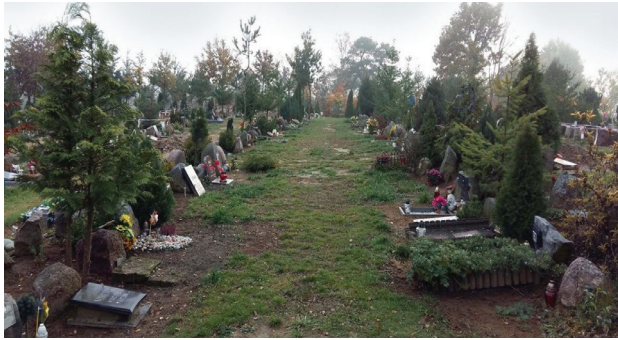
Il. 2. Grzebowisko Brzozowa Przystań, Mochle (źródło: http://brzozowaprzystan.pl/wp-content/uploads/2015/11/cmentarz_dla_zwierzaja_bydgoszcz-3.jpg [data dostępu: 7.08.2017])

Fig. 2. Pet cemetery Brzozowa Przystań in Mochle (source: http://brzozowaprzystan.pl/wp-content/uploads/2015/11/cmentarz_dla_zwierzaja_bydgoszcz-3.jpg [accessed: 7.08.2017])