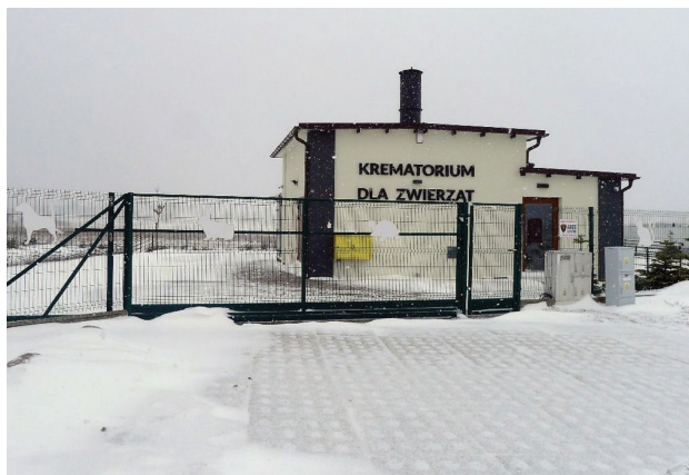
Il. 6. Gdańsk, grzebowisko Zawsze Razem