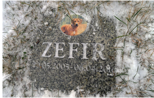
Il. 3. Gdańsk, grzebowisko Zawsze Razem – typowy nagrobek

Fig. 2. Pet cemetery Brzozowa Przystań in Mochle