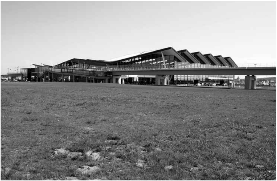
Przystanek Gdańsk Port Lotniczy zrealizowany na estakadzie, zintegrowany z terminalem lotniczym