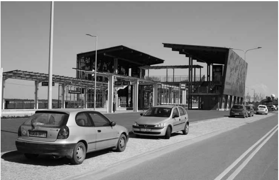
Przystanek Gdańsk Rębiechowo zintegrowany z parkingiem strategicznym Park & Ride (w budowie), mającym obsługiwać miejscowości podmiejskie