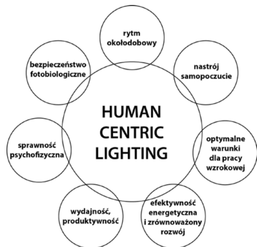
3 Wybrane aspekty koncepcji według Human Centric Lighting Society [14]

Niemniej jednak naukowcy badający procesy wpływu światła na organizm ludzki są ostrożniejsi. Wskazują, że za rozwojem nauk fotometrycznych, a zwłaszcza parametryzacji wpływu oświetlenia na funkcje wizualne człowieka, stały metody zorientowane na jego potrzeby (ang. human-centered ) [1]. Zaś biologiczne efekty ekspozycji na światło o danej charakterystyce zależą od wielu subiektywnych cech organizmu, takich jak historia ekspozycji świetlnej, płeć, wiek, przystosowanie wynikające z zamieszkania w danej strefie szerokości geograficznej, chronotyp, preferencje itp.