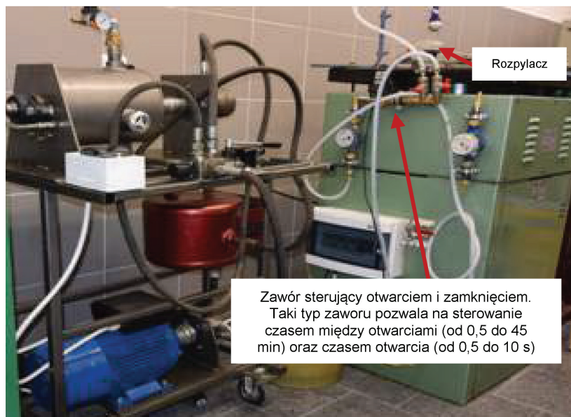
Rys. 3. Zamknięty zbiornik z zawiesziną ścierną wraz z mieszadłem