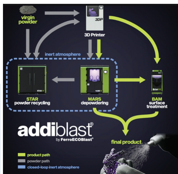
Rys. 1. Rozwiązanie dotyczące integracji urządzeń do realizacji post-processingu wydrukowanych elementów

Pierwsze z zaprezentowanych urządzeń stanowi jednostka przeznaczona do usuwania niewykorzystanego w procesie materiału z wydrukowanego elementu – MARS ( Metal Additive Removal System ). Efektywne usuwanie nadmiaru materiału oraz jego recykling umożliwiają ponowne wykorzystanie w kolejnym procesie szybkiego prototypowania, co stanowi kluczowy element w redukcji kosztów produkcji addytywnej części. Urządzenie tego typu przystosowane jest do pracy zarówno w trybie ręcznym, jak i również automatycznym elementów o złożonych kształtach oraz masywnych części – rysunek 2. W przypadku wspomnianych masywnych konstrukcji systemy tego typu wyposażone są w dodatkowe rozwiązania, m.in. w postaci automatycznych drzwi, umożliwiające bezpieczny transport i załadunek części. Dzięki