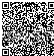
Rys. 3. Wizytówka autorki – kod QR

Za pomocą QR kodu można zapisać m. in. adres URL witryny, jakiegokolwiek tekst, numer telefonu, adres e-mail, vCard (wizytówka zawierająca imię, nazwisko oraz dane kontaktowe – rys. 3), SMS (numer telefonu, wiadomość), notatkę dotyczącą wydarzenia (nazwa, data oraz czas trwania, opis), współrzędne geolokalizacji (m.in. restauracji, hoteli), wifi network (SSID, hasło, typ sieci).