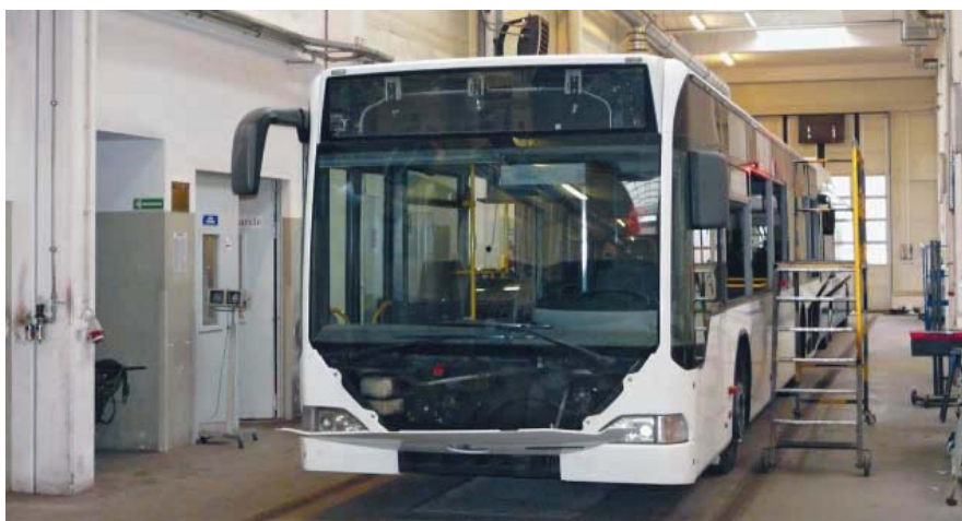
Fot. 09.jpg: Nadwozie autobusu Mercedes Benz O530 w trakcie prac dostosowawczych w procesie konwersji na trolejbus, Gdynia, zajezdnia trolejbusowa na Grabówku, 24.03.2011 r.