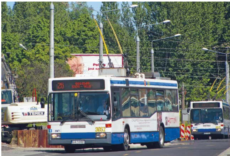
Fot 01 Jedyny egzemplarz trolejbusu MB O405N2 z napędem impulsowym. Na dachu umieszczona przed podstawą odbieraków prądu przetwornica statyczna, nr tab. 3052