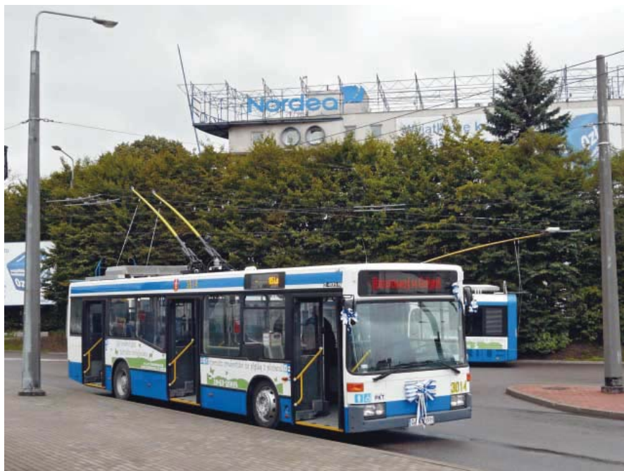
Fot. 08.jpg: Oficjalna prezentacja trolejbusu MB O405N2 nr tab. 3014 z okazji 65 rocznicy uruchomienia komunikacji trolejbusowej w Gdyni, Gdynia, pętla autobusowo-trolejbusowa na Węzle im. F. Cegielskiej, 22.09.2008 r.

Nowy napęd zastosowany w kolejnej wersji trolejbusów posiada silniki prądu przemiennego o mocy 170 kW, możliwość hamowania odzyskowego oraz charakteryzuje się oszczędnością w zakresie zużycia energii na poziomie 20-25% w stosunku do wcześniejszych pojazdów wyposażonych w układ napędu stycznikowego. Poza napędem głównym zastosowano