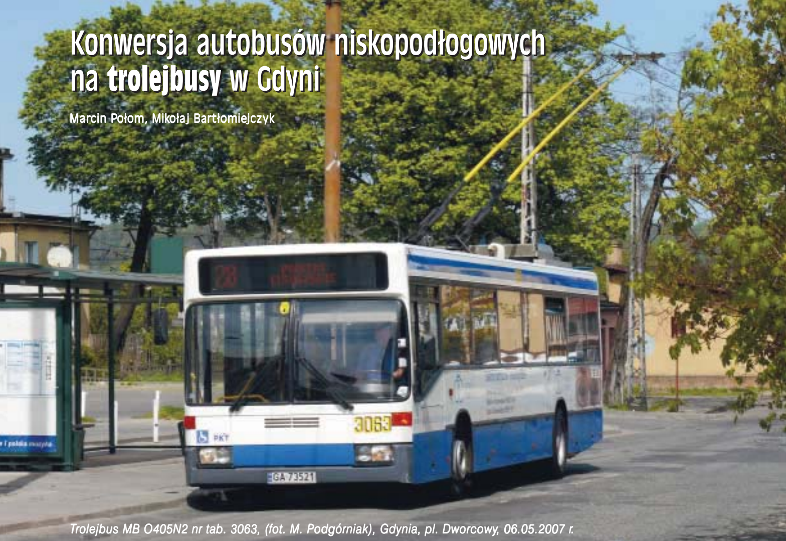
Trolejbus MB O405N2 nr tab. 3063, Gdynia, pl. Dworcowy, 06.05.2007 r.