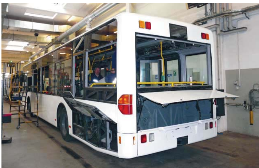
Przystosowywanie tylnej części pierwszego nadwozia Mercedes Benz O530 do zabudowy aparaturą napędu elektrycznego, Gdynia, zajezdnia trolejbusowa na Grabówku, 24.03.2011 r.