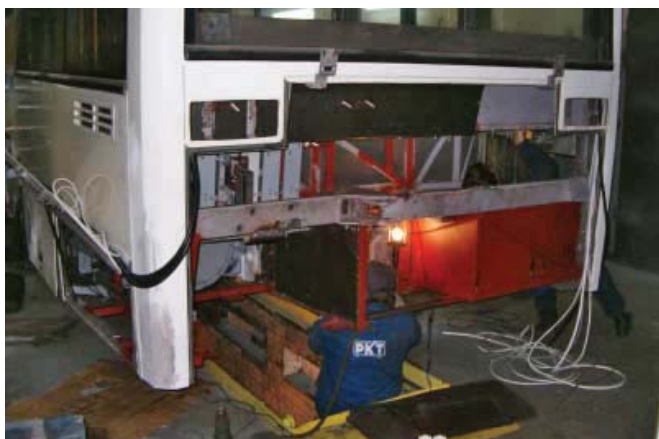
Fot. 05.jpg: Przygotowanie konstrukcji pod zabudowę aparatury napędu elektrycznego w dawnej komorze silnika spalinowego, w pierwszym egzemplarzu trolejbusu MB O405N2, Gdynia, zajezdnia trolejbusowa w Redłowie, 21.10.2004 r.

Do napędu zastosowano szeregowo-bocznikowy silnik DK210A3P/11 z układem oporowego rozruchu, wprowadzono jednak wiele zmian w układzie napędowym w stosunku do Jelcza PR110E (silnik oraz większość części pochodziły z kasowanych trolejbusów marki Jelcz). Z najważniejszych zmian można wymienić modyfikację sposobu wzbudzenia silnika trakcyjnego [5],