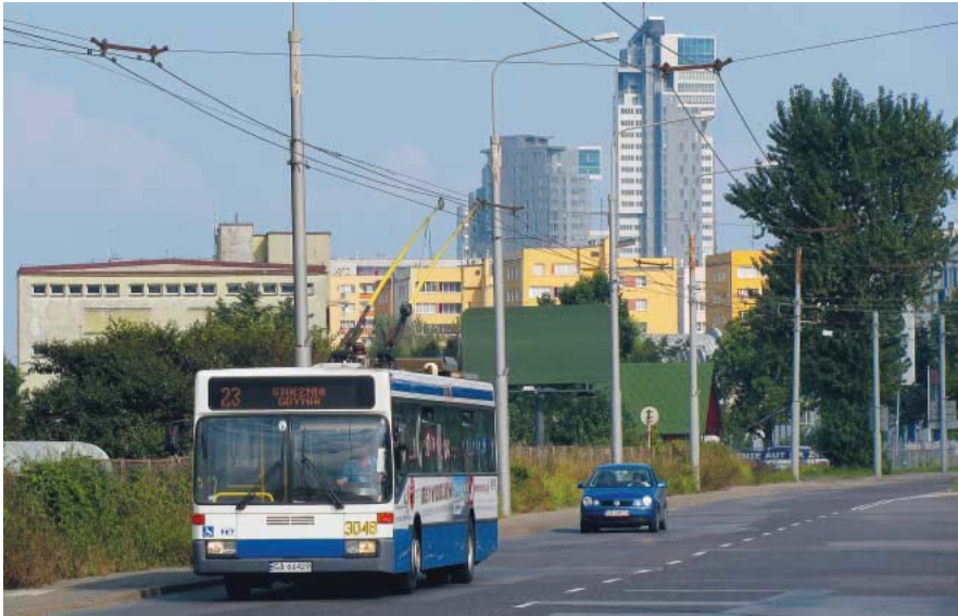
Fot. 02.jpg: Drugi egzemplarz trolejbusu MB O405N2 z napędem stycznikowym, nr tab. 3048 (, Gdynia, ul. Janka Wiśniewskiego, 11.08.2010 r.)