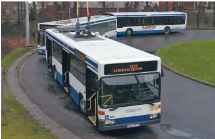
Pierwsza nieoficjalna prezentacja prototypowego trolejbusu MB O405N2 z napędem stycznikowym, nr tab. 3046, Gdynia, pętla autobusowo-trolejbusowa Pustki Cisowskie, 30.11.2004 r.

W trakcie prac przygotowawczych pojawił się problem natury formalno-prawnej związany ze sposobem rejestracji przebudowanego pojazdu, wynikający z wieloznaczności przepisów prawnych określających wymagania techniczne i sposób dopuszczenia do ruchu trolejbusów. Po rozwiązaniu tego problemu i uzyskaniu akceptacji zaproponowanych rozwiązań rozpoczęto proces nabycia autobusu. „Dawcą” nadwozia do pierwszego trolejbusu był Mercedes Benz z 1993 roku pochodzący z niemieckiego Erfurtu, gdzie był eksploatowany pod numerem taborowym 128. U podstaw projektu założono, że nadwozia autobusów wykorzystywanych do przebudowy na trolejbus powinny mieć maksymalnie 10 lat. We wrześniu 2004 r. wykonawca