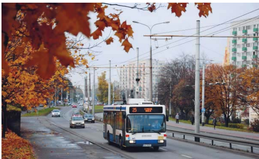
Fot. 10.jpg: Piąty egzemplarz trolejbusu MB O405N2AC z napędem asynchronicznym