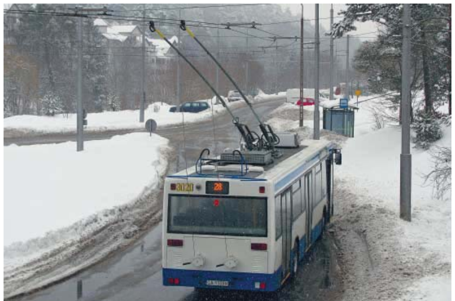
Fot. 03.jpg: Drugi egzemplarz trolejbusu MB O405N2AC z napędem asynchronicznym. Na dachu pojazdu umieszczona przetwornica statyczna, podstawa z odbierakami prądu i rezystor hamowania, nr tab. 3020 (, Gdynia, pętla autobusowo-trolejbusowa Pustki Cisowskie, 14.02.2010 r.)

Projekt konwersji autobusów na trolejbusy jest oryginalną koncepcją niskobudżetowego pozyskania znaczącej liczby trolejbusów niskopodłogowych w celu wyrównania dysproporcji jakie pojawiły się między komunikacją trolejbusową, a autobusową w Gdyni. Alternatywa budowy trolejbusów opartych o nadwozia autobusów pochodzących z rynku wtórnego względem przeprowadzania dalszych napraw głównych trolejbusów wysokopodłogowych Jelcz okazała się sukcesem ze względów zarówno społecznych jak i ekonomicznych. Idea, która zrodziła się w 2003 r. doprowadziła do powstania 28 trolejbusów przy 85 łącznie posiadanych przez Przedsiębiorstwo Komunikacji Trolejbusowej w Gdyni (wg stanu na marzec 2011 r.), co stanowi ok. 34% całości parku taborowego.