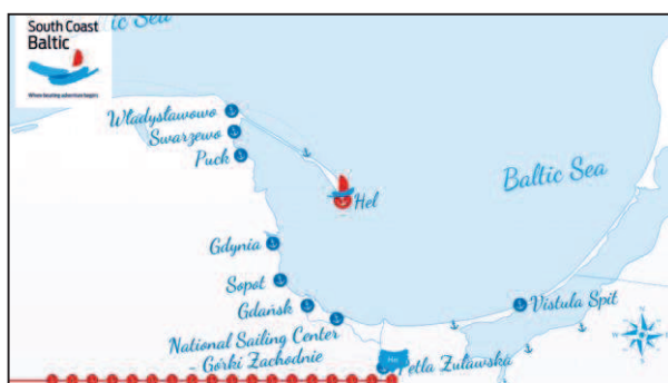
Rys. 3. Wirtualny rejs jachtem wzdłuż południowego brzegu Bałtyku

Źródło: opracowanie własne na podstawie South Coast Baltic – Impressions , www.youtube.com/watch?v=KnwEw8Ttktc (10.06.2015).