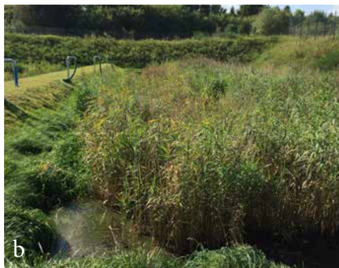
Rys. 8.2. Obiekty trzcinowe (STRB): a) rzut z góry na oczyszczalnię w Helsingørze (Dania), b) złoża trzcinowe w Gniewinie (Polska); źródła: Nielsen (2003), fotografia własna