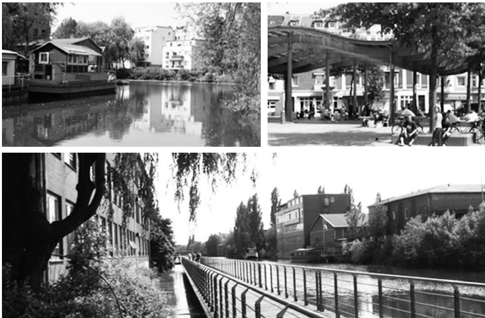
Fot. 7. Inwestycje w system przestrzeni publicznych poprawiających jakość życia w rejonie Wyspy Wilhelmsburg w okresie półmetka pracy IBA Hamburg (ok. 2009 r.)

pujące po niej wieloletnie zaniedbania, wymagające u progu XXI w. publicznych programów odnowy [Plagemann 2003].