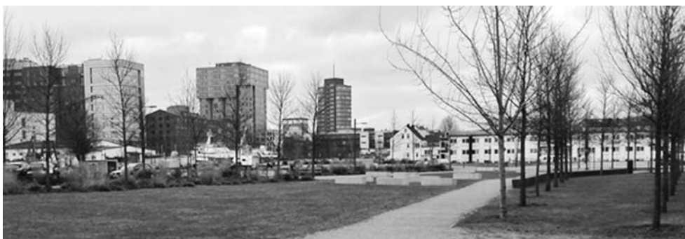
Fot 12: Harburg Binnenhafen widok od strony Schloßinsel na rejon dawnego Güterbahnhofs-gelände . W sylwecie czytelne są nowoczesne dominanty biurowców (od lewej) Keispeicher am Binnenhafen , Das Silo i Channel Tower

Binnenhafen mozaiki programów miejskich 27 . Rozwój metrozony postępuje sukcesywnie na podstawie ustaleń masterplanów sformułowanych na bazie konkursów urbanistycznych i wyników procesu konsultacyjno-negocjacyjnego. Program nowego zagospodarowania dawnego dworca towarowego Güterbahnhofs-gelände (konkurs 2000) 28 zakłada wprowadzenie zróżnicowanej typologii zabudowy mieszkaniowej, która z tematem pracy połączona została dzięki adaptacji i uzupełnieniom struktur dawnych magazynów na funkcje biurowe (fot. 12). Ich wizerunkową rolę podkreślono w sylwecie, w której czytelne są dominanty krajobrazowe trzech biurowców Channel Tower (2002), Keispeicher am Binnenhafen (2003) oraz Das Silo (2004) 29 – ikoniczny dawny silos zbożowy mieszczący dziś międzynarodowe centrum biznesu (fot. 13).