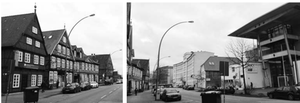
Fot. 11. Schloßstraße historyczne budynki mieszczące szkołę muzyczną, drobne usługi i gastronomię, po prawej nowoczesne centrum innowacji i przedsiębiorczości TUTECH

Binnenhafen mozaiki programów miejskich 27 . Rozwój metrozony postępuje sukcesywnie na podstawie ustaleń masterplanów sformułowanych na bazie konkursów urbanistycznych i wyników procesu konsultacyjno-negocjacyjnego. Program nowego zagospodarowania dawnego dworca towarowego Güterbahnhofs-gelände (konkurs 2000) 28 zakłada wprowadzenie zróżnicowanej typologii zabudowy mieszkaniowej, która z tematem pracy połączona została dzięki adaptacji i uzupełnieniom struktur dawnych magazynów na funkcje biurowe (fot. 12). Ich wizerunkową rolę podkreślono w sylwecie, w której czytelne są dominanty krajobrazowe trzech biurowców Channel Tower (2002), Keispeicher am Binnenhafen (2003) oraz Das Silo (2004) 29 – ikoniczny dawny silos zbożowy mieszczący dziś międzynarodowe centrum biznesu (fot. 13).