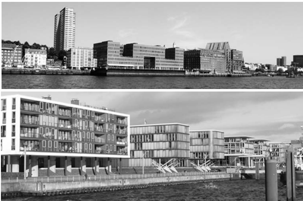
Fot. 4. Biurowce przy promenadzie wzdłuż Łaby w ramach programu Perlen Kette (górne) rejon Fishmarkt, (dolne) rejon Neumühlen

poprzednich oraz trwających równolegle edycji IBA. Podobnie jak w Berlinie (1979-1987), w Zagłębiu Ruhry (lata 1989-1999) czy na Łużycach (2000-2010), IBA rozumiana była jako narzędzie urbanistyki operacyjnej poszukującej nowych rozwiązań i uniwersalnych modeli wykorzystania dotąd nieaktywnych potencjałów [Rembarz 2018b]. Wybór tego formatu, na niemal dekadę zapewnił przekształcanemu obszarowi specjalny, eksperymentalny status. Dzięki niemu zarówno sam rejon w granicach IBA, jak i złożenie problemów oraz proces poszukiwań i wdrożenia rozwiązań, rozpatrywano w formule laboratorium miejskiego (niem. StadtLabor ) [Koch 2013]. W uzasadnionych przypadkach zawieszeniu ulec mogły przepisy regulujące nie tylko kształtowanie przestrzeni, ale też zasady zarządzania i finansowania publicznych i publiczno-prywatnych przedsięwzięć. Rezultaty wypracowane w ramach StadtLabor IBA posiadały potencjał stania się modelowymi rozwiązaniami, z perspektywą upowszechnienia przez szeroką implementację, zarówno w ich wymiarze technicznym, jak i administracyjnym (prawno-ekonomicznym).