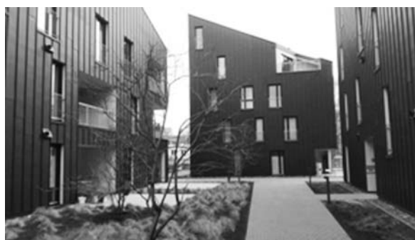
Fot. 15. Zespół zabudowy mieszkaniowej przy Kaufhaus Kanale