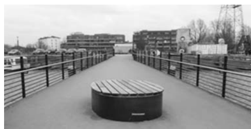
Fot. 18. Malowniczość krajobrazu i nowa estetyka przestrzeni publicznych nowego zagospodarowania nabrzeży Harburger Binnenhafen umacniają kulturę dnia codziennego