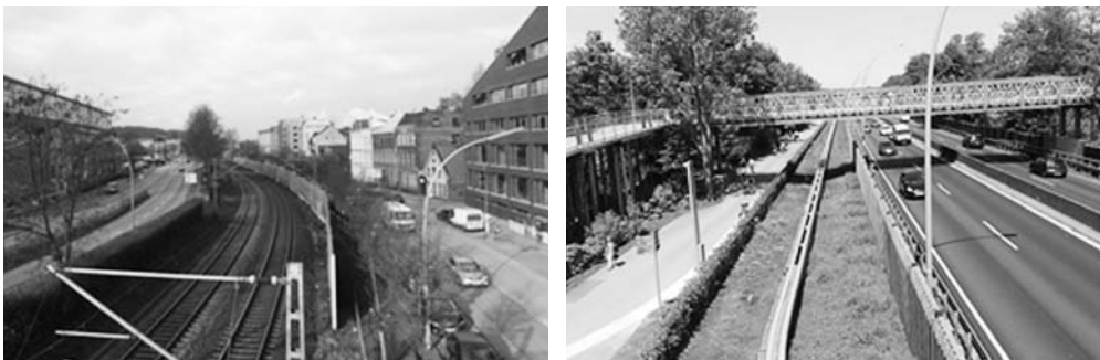
Fot. 10. Główne problemy przestrzennie zintegrowanego rozwoju metrozone na przykładzie rejonu IBA Hamburg: rdzeń komunikacyjny dla obsługi Harburger Binnenhafen w rejonie ulicy Karnapp; widok z kładki pieszej przy biurowcu Channel Tower (po lewej), Wihelmsburger Reichstraße przecinającej Wyspę i tereny IGA 2013 widok na tymczasowa pieszą kładką z wagonu monorail (po prawej)

innowacji oraz nowymi programami biurowo-mieszkaniowymi, zachowując cenne wyważenie skali i ziarnistości tkanki przeniesione do nowych realizacji (fot. 11). Wyodrębniający się architektonicznie budynek TUTECH 24 jest istotną dla realizacji strategii rozwoju metrozone placówką mieszczącą wspólne przedsięwzięcie gospodarcze Technischen Universität Hamburg i miasta Hamburg wspomaganym przez Hamburg Innovation. Jego celem jest łączenie działających w ramach metropolii Hamburga uczelni wyższych oraz instytucji naukowo-badawczych z prywatnym sektorem przedsiębiorczości. Jednym z wyznaczników jego potencjału jest stowarzyszenie channel hamburg e.V. 25 zrzeszające podmioty gospodarcze działające w Harburger Binnenhafen . Firmuje ono najnowsze przedsięwzięcie tej wzrastającej dzielnicy Hamburg Innovation Port 26 dedykowane rozwojowi technologii cyfrowych. Jego otwarcie na Ziegelwiessenkanal w połowie 2019 r.