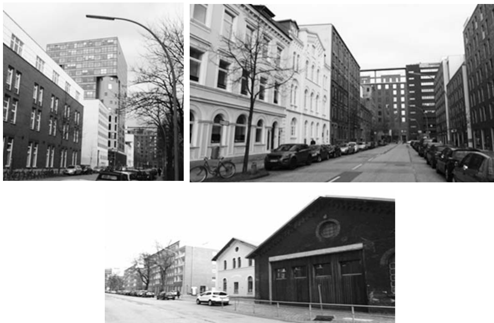
Fot 14: Hafencampus na terenach dawnego dworca towarowego w rejonie ulicy Schellerdamm