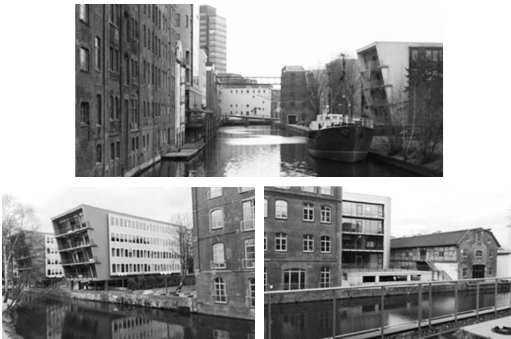
Fot. 13. Obiekty biurowe – nowe budynki i adaptowane lofty po obu stronach Westlicher Bahnhofskanal