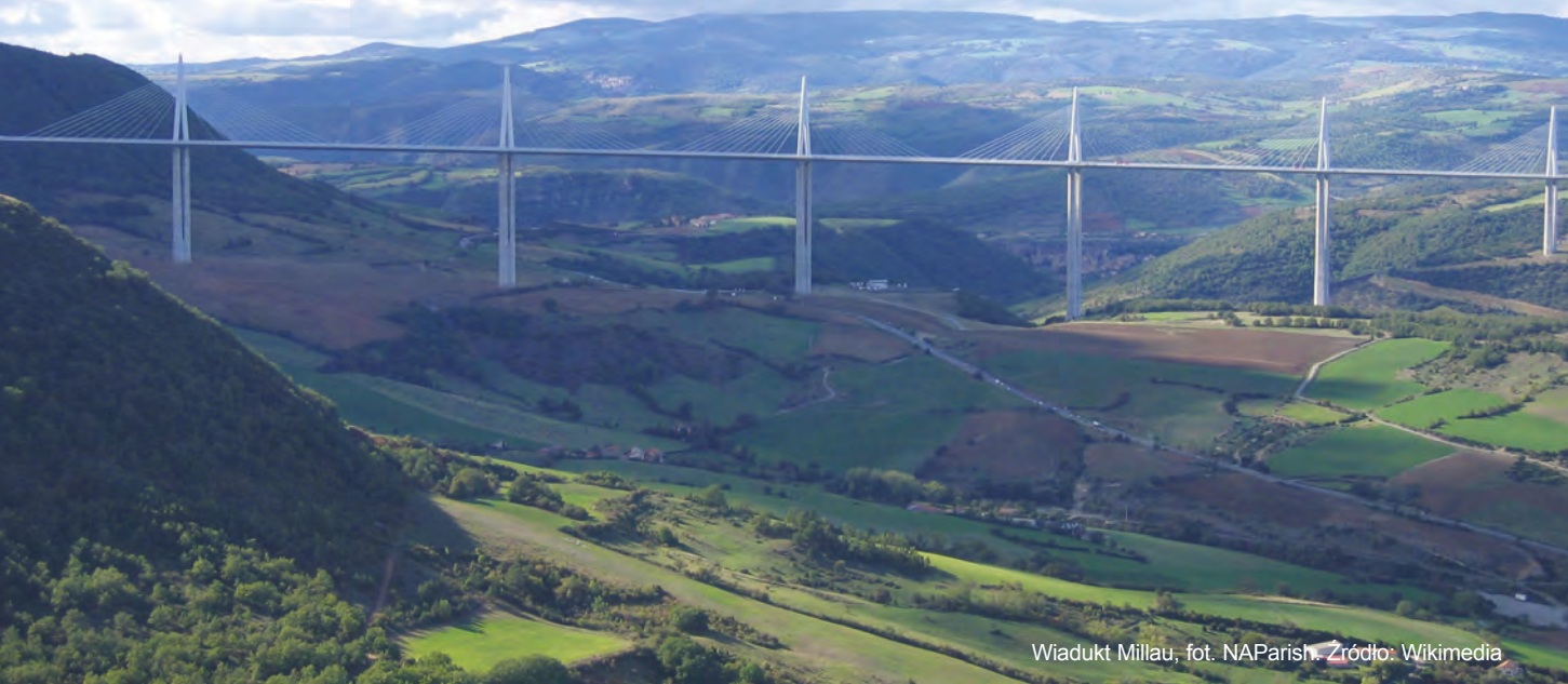
Wiadukt Millau

Duże, współcześnie realizowane obiekty mostowe są projektowane z efektywnym wykorzystaniem wiedzy teoretycznej dotyczącej optymalnego i bezpiecznego konstruowania. Pomimo tych ograniczeń można jednak strukturze nadać piękną formę.