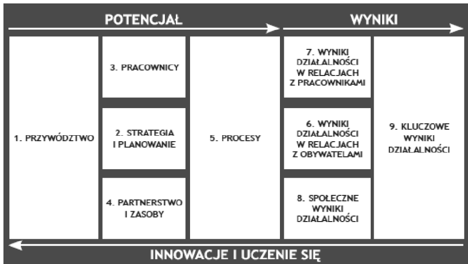
Rys. 2. Powszechny Model Oceny – kryteria oceny oraz wzajemne relacje

EIPA) w Maastricht. W 2000 r., podczas Europejskiej Konferencji Zarządzania Jakością w Administracji Publicznej w Lizbonie – dyrektorzy generalni administracji publicznej oficjalnie zalecili CAF do stosowania przez organizacje administracyjne krajów Unii. W latach 2000-2005, jak podano w [Wspólna metoda... 2008], ok. 900 instytucji w krajach członkowskich UE stosowało tę metodę w celu doskonalenia organizacji.