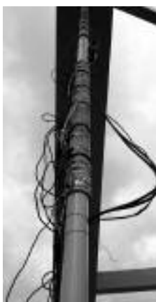
Fot. 4. Nagrzewanie wieszaka indukcyjnymi matami grzewczymi

F [N] – siła normalna w cięgnię; p [kg/m] – liniowa gęstość masy; L [m] – długość cięgna; E [MPa] – moduł sprężystości cięgna; S [m 2 ] – przekrój nośny cięgna; f [m] – strzałka ugięcia cięgna.