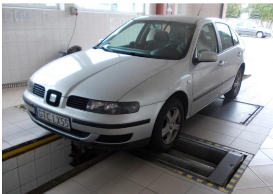
Rys. 1. Widok przodu i boku samochodu Seat Leon na stanowisku diagnostycznym

Widok załadowanego samochodu Seat Leon (5 litrowymi pojemnikami z płynem) w trakcie przeprowadzanych badań wpływu ciężaru pojazdu na wskaźnik skuteczności hamowania przedstawiają rys. 2 i rys. 3.