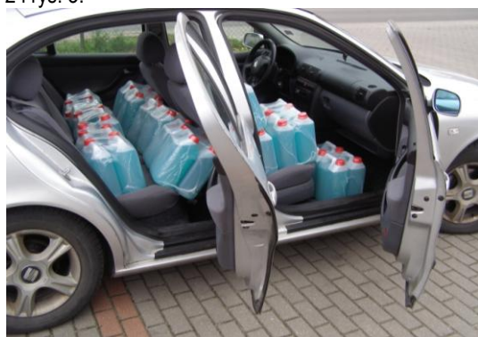
Rys. 2. Widok częściowego obciążonego samochodu Seat Leon

Widok załadowanego samochodu Seat Leon (5 litrowymi pojemnikami z płynem) w trakcie przeprowadzanych badań wpływu ciężaru pojazdu na wskaźnik skuteczności hamowania przedstawiają rys. 2 i rys. 3.