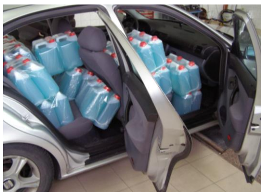
Rys. 3. Widok maksymalnie obciążonego samochodu Seat Leon