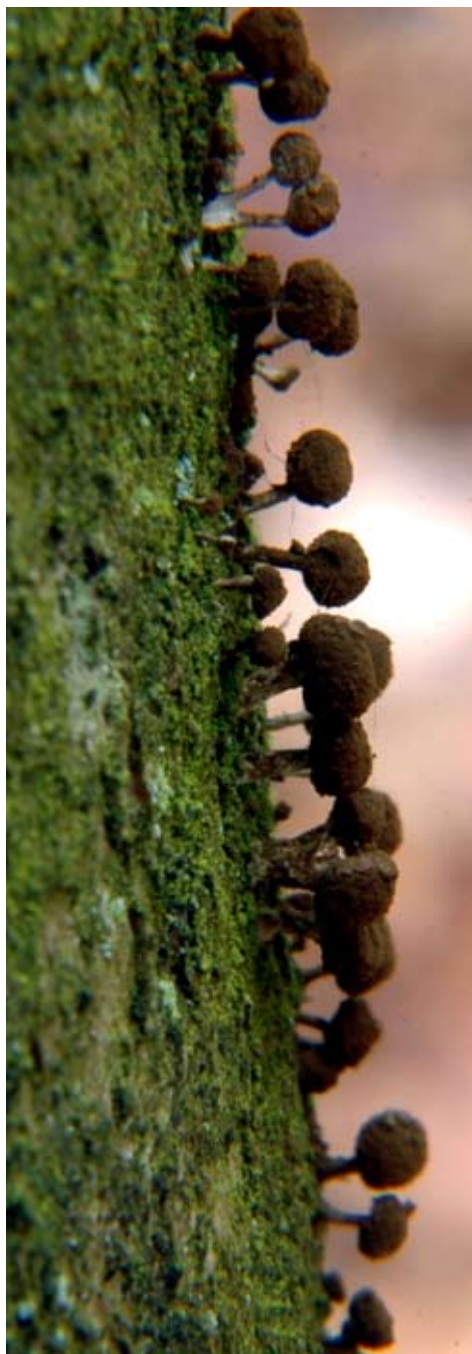
Ryc. 1. Owocniki suchogłówki korowej Phleogena faginea .

Owocniki wyrastają na korowinie, w spękaniach kory lub na murszejącym drewnie pniaków, pni lub konarów martwych lub zamierających, rzadko żywych drzew (ryc. 1).