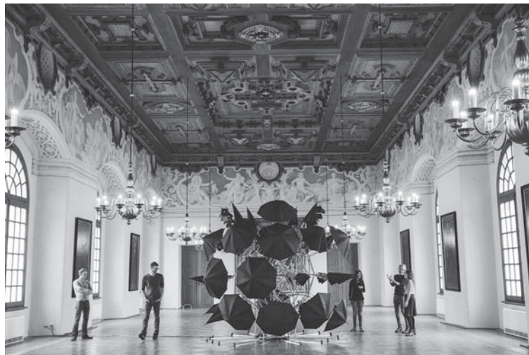
Fot. 2. Instalacja interaktywna Surface X, autorstwa grupy Picaroon

Pierwszym przykładem takiej sztuki jest instalacja o nazwie “Softer” w obiekcie już wcześniej wspomnianym w Pałacu Blenheim w Anglii, która odbywała się od 28 września do 31 grudnia 2017 r. Tym razem autorką jest Amerykanka Jenny Holzer, która w swej twórczości koncentruje się na współczesnych konfliktach. Inspiracją dla jej instalacji była wojskowa historia pałacu. Barokowy zespół pałacowo-parkowy stanowił podarunek królowej dla Johna Churchilla, hrabiego Marlborough, za zwycięstwo w bitwie w 1704 r. Artystka użyła tego dziedzictwa jako punkt wyjścia do spojrzenia na ponadczasowy i uniwersalny temat konfliktów [ Blenheim Art Foundation 2017]. Do realizacji wykorzystała elementy kamienne, technologię, aplikacje