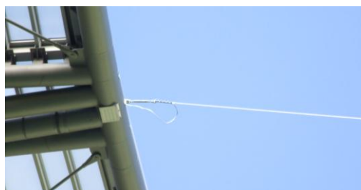
Rys. 6. Konstrukcja zwodu poziomego chroniącego teren boiska; widoczny jeden z trzech zwodów poziomych przymocowany do rury łączącej dźwigary

Kolejne obszary zagrożone bezpośrednim uderzeniem pioruna to rejony szczytów schodów zewnętrznych (C na rys. 4) prowadzących do obiektu. Strefy ochronne tych rejonów tworzą zwody pionowe o wysokości 4 – 6 m, tak aby wysokość strefy nie była mniejsza niż 2,5 m. Zwody są połączone bezpośrednio z uziemieniem stadionu.