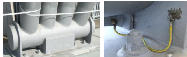
Rys. 8. Widok przegubu łączącego dźwigar zadaszenia z systemem uziemieniowym stadionu, widoczny mostek zwierający elektrycznie części ruchome

Uziemienie odgromowe. Stadion (budynek główny, promenady i trybuny) ma konstrukcję żelbetową, a więc jako naturalne uziemienie odgromowe obiektu wykorzystano zbrojenie jego stóp fundamentowych. Znaczne ich rozmiary i liczba zapewniają bardzo małą wartość rezystancji uziemienia, która spełnia zalecenia normy [12], a więc jest wystarczająco mała dla potrzeb wszystkich przyłączonych instalacji. Fakt ten potwierdziły przeprowadzone pomiary statycznej rezystancji uziemienia. Wypadkowa wartość statycznej rezystancji systemu uziemiającego stadionu wynosi 1,1 \Omega [17]. W miejscach, w których należy spodziewać się większych skupisk ludzkich (np. w strefach wejściowych), przewidziany został dodatkowo sztuczny uziom kratowy z okami o wymiarach około 3 x 3 m. Dalszą poprawę bezpieczeństwa widzów uzyskano przez zastosowanie nawierzchni betonowych.