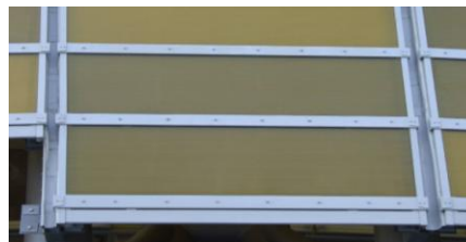
Rys. 7. Widok fragmentu konstrukcji pokrycia dachu stadionu; widoczne aluminiowe kształtowniki do mocowania płyt poliwęglanowych [fot. D. Kowalak]

Przewody odprowadzające. Rolę naturalnych przewodów odprowadzających pełnią w omawianym LPS dolne części (poniżej linii A – rys. 4) dźwigarów podtrzymujących zadaszenie trybun, posadowione na specjalnych przegubach (rys. 8) umożliwiających przemieszczanie się elementów wynikające z rozszerzalności cieplnej konstrukcji. Mostki widoczne na rysunku 8 tylko zwierają elektrycznie elementy ruchome przegubu, nie są to zaciski probiercze.