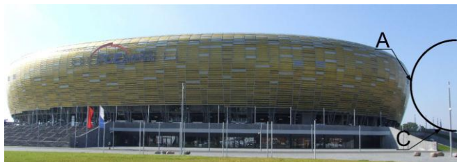
Rys. 4. Szkic zasady wykorzystania metody toczącej się kuli ( R = 20 m) do wyznaczenia stref ochronnych na stadionie PGE ARENA (owalna korona o wymiarach 234 m x 204 m x 45,2 m); A – punkty wyznaczające linię graniczną obszaru zadaszenia trybun oraz C – rejon schodów zewnętrznych prowadzących do obiektu zagrożonych uderzeniem pioruna

większa niż wysokość elementów zwodów wystających ponad powierzchnię płyty poliwęglanowej. Sprawdzone jednak, że ewentualne uderzenie pioruna w płytę nie wiąże się z jakimkolwiek niebezpieczeństwem (zapalenia płyty lub opadnięcia odłamków zniszczonej płyty) dla widzów przebywających na trybunie [17].