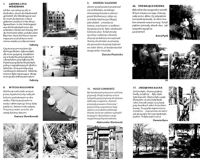
Fot. 3. Fragmenty przewodnika po Dolnym Mieście w Gdańsku wydanego w ramach projektu „Ścieżki żywej pamięci”