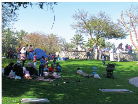
Fot. 12. Creek Side Park, Dubaj. Urządzona przestrzeń publiczna sprzyja integracji

Te dwa, jakże odmienne przykłady, dowodzą zasadności decyzji na rzecz poprawy jakości życia przez tworzenie atrakcyjnego krajobrazu miejskich parków. Można by je mnożyć, wymieniając chociażby parki nadwodne stworzone na terenach poportowych w Montrealu, Barcelonie czy Kopenhadze. Jednak prawdziwym wyzwaniem dla projektantów i zarządców zieleni miejskiej są trudne warunki klimatyczne i wodne. Przykładem pokonywania