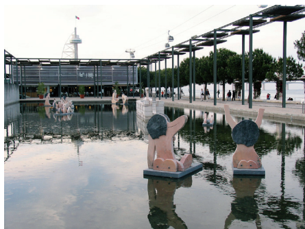
Fot. 3. Miasto stało się wodną rzeźbą osnutą refleksami świetlnymi i odbiciami