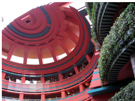
Fot. 13. Canal City Hakata, Fukuoka. Woda płynąca przez budynek i ostry kolor wewnętrznej elewacji tworzą widowiskowe przestrzenie