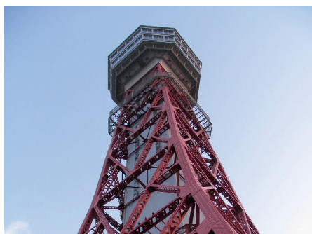
Fot. 15. Fukuoka. Wieża Portowa stanowi dominantę waterfrontu i doskonały punkt obserwacyjny