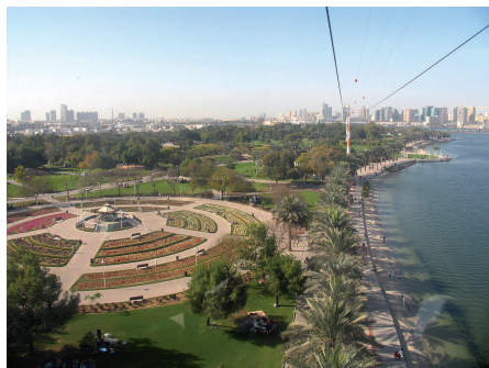
Fot. 9. Creek Side Park w Dubaju rozciąga się wzdłuż rzeki Dubai Creek na odcinku ok. 3 km. Na całej długości od strony rzeki ciągną się piaszczyste plaże

kolejne ulepszenia i elementy. Co jest podkreślane, projekt zrealizowano nie tylko dzięki twórczej wizji i hojności donatorów, ale też pracy wolontariuszy. Dlatego ten piękny seminaturalny park, jakże inny w wyrazie niż park miejski w Lizbonie, zadedykowano tym, którzy sprawili, że „marzenie o stworzeniu terenu zieleni i rekreacji w tym miejscu się urzeczywistniło”.