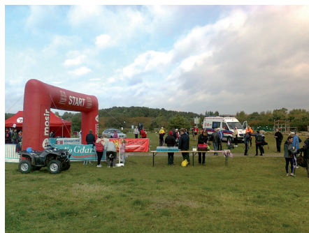
Fot. 18. Rozległe zielone tereny pasa nadmorskiego sprzyjają organizacji imprez masowych, m.in. zawodów Nordic Walking