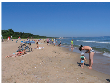
Fot. 17. Szeroka, piaszczysta plaża w Gdańsku jest unikatowa w skali europejskiej przynajmniej z jednego powodu. Prawie z niej nie widać miasta

stałych użytkowników. Park został wyposażony w dużą ilość atrakcji i urządzeń dla dzieci, młodzieży i dorosłych. Zbudowano 9 km ścieżek pieszo-rowerowych, zrealizowano system informacji o parku, tablice edukacyjne, placky zabaw dla dzieci i młodzieży, wybiegi dla psów. Zieleń i mała architektura podkreślają jego walory przyrodnicze i krajobrazowe. Park Reagana wygrał konkurs TUP na najlepszą przestrzeń publiczną woj. pomorskiego w 2006 r.