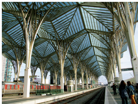
Fot. 1 3 . Lizbona. Zwiewna konstrukcja dworca kolejowego, nawiązująca do motywów roślinnych stała się wizytówką i znakiem rozpoznawczym nie tylko Expo'98 i Lizbony, ale też całej Portugalii

100 tys. rodzimych roślin z 73 rodzimych gatunków. Usunięto 70 akrów asfaltu i wielką ilość niebezpiecznych materiałów. Rozciągający się wzdłuż wybrzeża obszar podzielono na strefy funkcjonalne. Wykopano sztuczny zbiornik wodny.