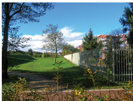
Fot. 19. Osiedle grodzone między Parkiem Reagana a morzem to typowy przykład podziału nie tylko przestrzeni, ale i społeczeństwa