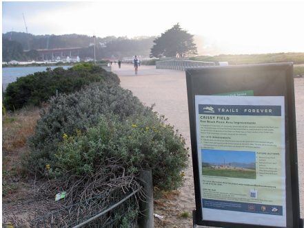
Fot. 5. Crispy Field, San Francisco. Ścieżki piesze są wyposażone w rozmaite tablice informacyjne

sca, ale też o zagrożeniach związanych z globalnym ociepleniem, powodzią, erozją brzegu morskiego, zarówno dla samego parku, jak i w kontekście ogólniejszym, dla świata. Można przeczytać, jak żyć w bardziej zrównoważony sposób, aby zapobiegać zagrożeniom, i jak włączać się do akcji proekologicznych.