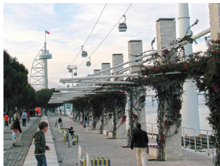
Fot. 2. Atrakcjami są kolejka linowa wzdłuż nabrzeża oraz wieża widokowa umożliwiające percepcję niezwykłego krajobrazu, w którym najważniejszym motywem jest woda