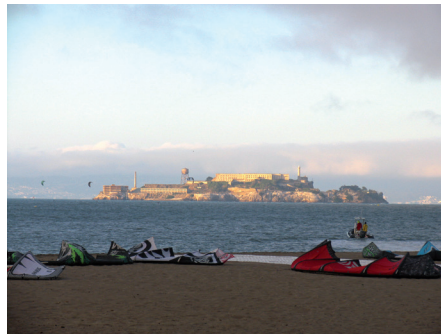
Fot. 8. Przyciągają tu nie tylko piękne widoki na Golden Gate, słynne więzienie Alcatraz i zatoka San Francisco, ale też możliwość obserwacji imprez i zawodów sportowych związanych z wodą

Do tej pory park odwiedziło ponad 10 mln osób. Rocznie korzysta z niego 1 mln ludzi, dziennie ponad 2,5 tys. Crispy Field stało się niezwykle popularnym miejscem odpoczynku, rekreacji i sportu. Dzięki projektowi nastąpiło połączenie dotychczas odizolowanego miasta z wodą. Co roku realizowane są