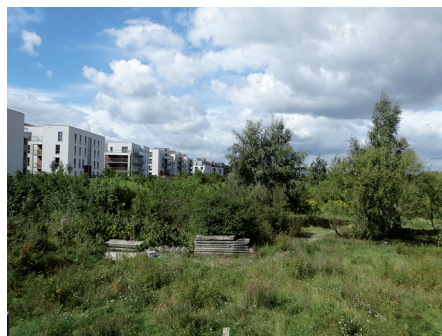
Fot. 20. Brzeźno. Nowe osiedle grodzone wzdłuż pasa nadmorskiego zapewnia piękne widoki na morze, ale zawłaszcza niezwykle przestrzeń publiczną

Realizacja Parku Reagana nawiązała do zrodzonej jeszcze na początku XX w. koncepcji stworzenia wielkiego publicznego parku plażowego między Jelitkowem a Stogami. Jak pisze Rozmarynowska [2011, s. 286], w 1924 r.