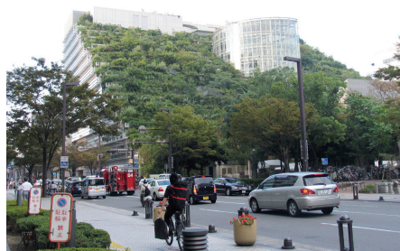
Fot. 14. Fukuoka. ACROS. Zielona architektura z tarasowymi zielonymi ogrodami organicznie wtapia się w otoczenie budynku