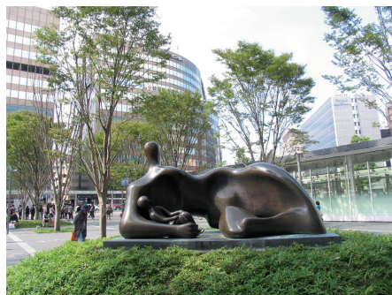
Fot. 16. Przykładem sztuki w przestrzeni publicznej jest rzeźba „Dropped Reclining Mother and Baby”

Ćwierć wieku temu ustanowiono „The Fukuoka City Urban Beautification Awards” (w dowolnym tłumaczeniu Nagrodę urbanistycznego upiększania miasta Fukuoki ), promującą wybitne obiekty i działania wpływające na poprawę estetyki przestrzeni. W dwudziestą rocznicę, w 2007 r., opracowano „mapę wizualnych atrakcji Fukuoki”, na której zaprezentowano elementy z zakresu architektury, krajobrazu miejskiego i otwartego oraz sztuki ulicznej, które przyczyniają się do wzmocnienia sfery publicznej miasta [ Visual Delights... ]. Zaprezentowano na niej przede wszystkim ikony architektury zaprojektowane przez słynnych japońskich i zagranicznych architektów. Wśród nich należy wymienić wielkie centrum usługowe Canal City Hakata, autor-