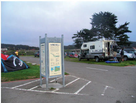
Fot. 7. System informacji turystycznej i ekologicznej, wpleciony w układ promenad, parkingów i miejsc biwakowych, towarzyszy wszystkim aktywnościom w bardzo popularnym parku