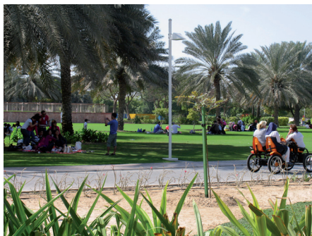
Fot. 10. Wielkość parku sprzyja „podróżom” specjalnymi pojazdami lub kolejką linową zawieszoną na odcinku 2,3 km, na wysokości 25 m