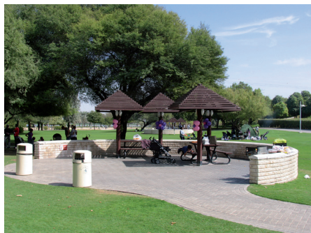
Fot. 11. Creek Side Park, Dubaj. Zacienione miejsca są w tym klimacie niezbędne