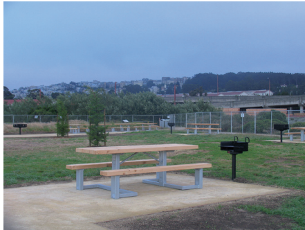
Fot. 6. Miejsca piknikowe dla osób indywidualnych i grup wyposażono w grille, siedziska oraz stoły