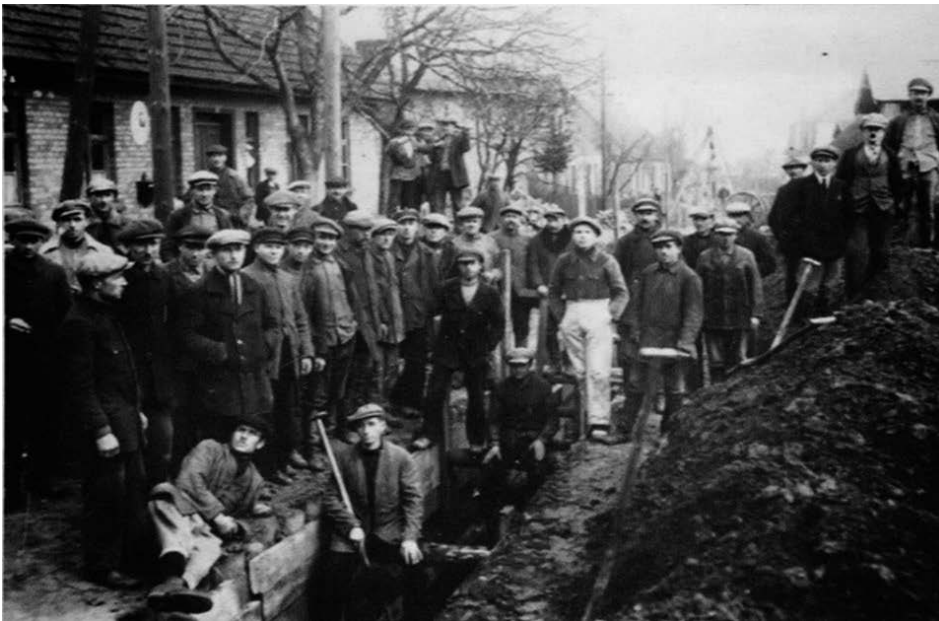
Rys. 4. Brygada robotników podczas układania rurociągu na Oksywiu