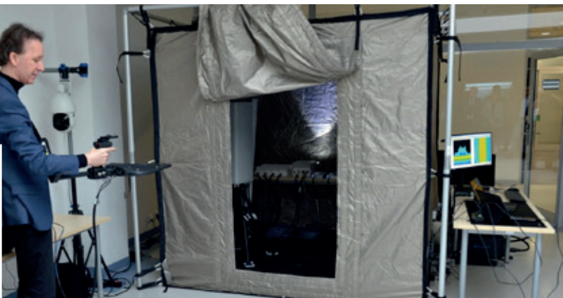
Fot. 1. Dr inż. Krzysztof Gierłowski przedstawia możliwości badań systemów RAN w zamkniętym środowisku propagacyjnym, jakim jest specjalizowany, ekranowany namiot