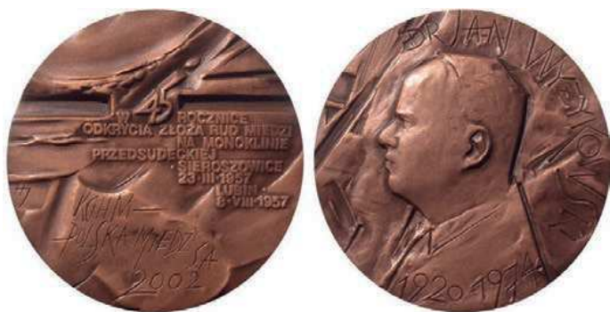
Rys. 8. Medal 45-lecia odkrycia złóż polskiej miedzi

Drugi medal z Janem Wyżykowskim został wyemitowany w 2002 r. z okazji 45-lecia odkrycia złóż rud miedzi (rys. 8). Na awersie na fakturowanej powierzchni znajduje się napis: W 45 ROCZNICĘ / ODKRYCIA ZŁOŻA RUD MIEDZI / NA MONOKLINIE / PRZEDSUDECKIEJ / SIEROSZOWICE / 23.III.1957 / LUBIN / 8.VIII.1957. W dolnej części: KGHM – / POLSKA MIEDŹ S.A. / 2002.