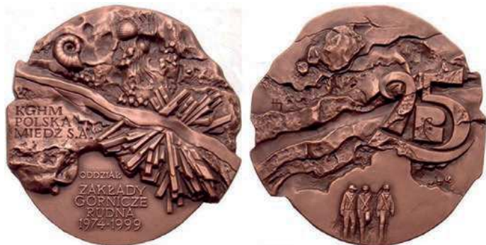
Rys. 36. Medal 25-lecia Zakładów Górniczych Rudna

Z tej samej okazji 40-lecia Zakładów Górniczych Rudna został wykonany żeton (rys. 39). Na awersie umieszczono zabudowania kopalni, nad nimi liczbę 40, w otoku napis: ODDZIAŁ ZAKŁADY GÓRNICZE RUDNA / 1974–2014, na rewersie napis KGHM na tle kuli ziemskiej z obrysem granic Polski, w otoku natomiast: ZDROWO JEST MIEĆ PRZY SOBIE MIEDŹ.