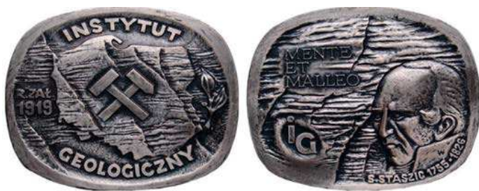
Rys. 62. Medal Instytutu Geologicznego z 1987 r.

ogólnokrajowym. Medal z okazji jubileuszu 50-lecia Instytutu Geologicznego został wydany w 1970 r. (rys. 61). Na awersie przedstawiono gmach Instytutu w Warszawie, poniżej napis: INSTYTUT GEOLOGICZNY / 1919–1969, w górnej części tarcza z godłem Polski, w dolnej skrzyżowane młotki otoczone wieńcem laurowym, w kwadracie otoku napis: 50 LAT W SŁUŻBIE NAUKI I GOSPODARKI NARODOWEJ, przy krawędzi nazwiska czterech polskich zasłużonych geologów: K. BOHDANOWICZ, J. CZARNOCKI, J. SAMSONOWICZ, J. MOROZEWICZ, na rewersie został wgłębiony zarys granic Polski, na nim rysunki wież wiertniczych i maszyn górniczych oraz symbole pierwiastków (w tym Cu). U dołu napis: MENTE / ET MALLEO (motto geologów, z łaciny: myślą i młotem). Autorem projektu jest Waclaw Kowalik. Medal