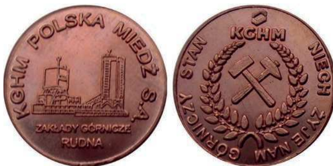
Rys. 40. Żeton Zakładów Górniczych Rudna

Czterdziestolecie Zakładów Górniczych Rudna zostało upamiętnione medalem w 2014 r. (rys. 38). Na awersie znajduje się liczba 40 z umieszczonymi na cyfrze 4 napisami: 1974–2014 / 40-lecie ZAKŁADÓW GÓRNICZYCH / „RUDNA”. Na rewersie pokazano stylizowaną zagłówkę na fali, u dołu napis: BARBÓRKA / 2014 (średnica 70 mm).