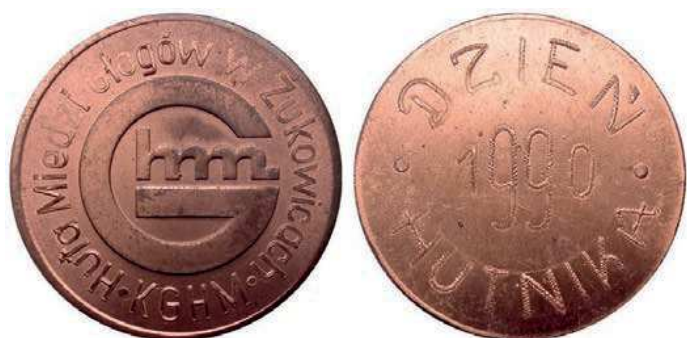
Rys. 48. Medal Huty Miedzi Głogów z okazji Dnia Hutnika 1990

Z 1989 r. pochodzi medal odlewany, upamiętniający 1 mln ton miedzi z Huty Miedzi Głogów II (rys. 49). Na awersie postać hutnika przy pracy, u góry przy krawędzi napisano: 1000000 a t Cu BLISTER. Na rewersie widnieje napis: OPMB / 15.07.1989, przy krawędzi: HM "GŁOGÓW II" / WYDZIAŁ METALURGICZNY P-9. Średnica medalu wynosi 97 mm, grubość ok. 15 mm.