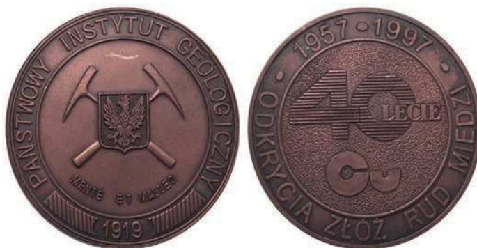
Rys. 63. Medal Państwowego Instytutu Geologicznego z okazji 40-lecia odkrycia złóż rud miedzi z 1997 r.

Z 1977 r. pochodzi medal 25-lecia Instytutu Metali Nieżelaznych (rys. 65). Na awersie na fakturowanej powierzchni umieszczono ówczesne logo Instytutu, w otoku napis: INSTYTUT METALI NIEŻELAZNYCH. Na rewersie znajduje się godło hutnicze w postaci skrzyżowanych narzędzi w kole zębatym. Przy krawędzi w górnej części: XXV – LAT, w dolnej: 1952–1977 (średnica to 74 mm).