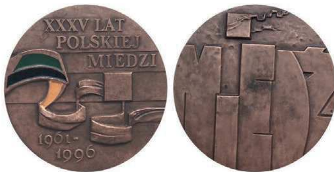
Rys. 15. Medal 35-lecia Polskiej Miedzi

Z 1996 r. pochodzi medal upamiętniający 35-lecie utworzenia Kombinatu Górniczo-Hutniczego Miedzi (rys. 15). Na awersie po obu stronach kwadratu jest falująca wstążka. Fragment został pokryty: zieloną, czarną i żółtą emalią. Zieleń i czerń symbolizują górnictwo, pomarańcz (na medalu błędnie kolor żółty) hutnictwo. W górnej części awersu napis: XXXV LAT / POLSKIEJ / MIEDZI. U dołu daty: 1961–1996. Na rewersie dużymi literami napis: MIEDŹ. U góry kostka z powiewającą wstęgą. Medal zaprojektowała i wykonała Hanna Jelonek (średnica 70 mm). W nakładzie 2000 sztuk wybiła go Mennica Państwowa.