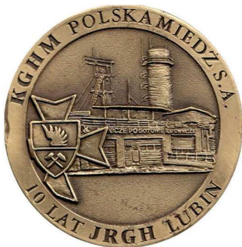
Rys. 32. Medal 10-lecia Jednostki Ratownictwa Górniczo-Hutniczego

W nakładzie 100 sztuk w tombaku srebrzonym i oksydowanym oraz 200 sztuk tombaku oksydowanym wybiła Mennica Państwowa (średnica 70 mm).