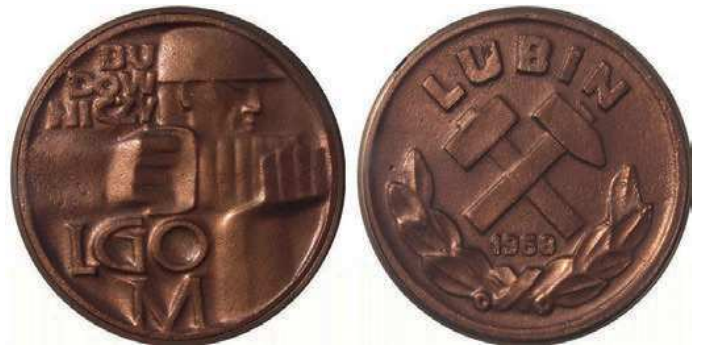
Rys. 23. Medal Budowniczy LGOM

Z okazji rozpoczęcia działania kopalni Rudna w 1968 r. został wydany medal dla budowniczych LGOM (Legnicko-Głogowski Okręg Miedziowy) – rys. 23. Na awersie przedstawiono postać górnika w profilu, trzymającego młot udarowy. U góry z lewej strony napis: BU / DOW / NICZY, u dołu: LGO / M. Na rewersie są dwa skrzyżowane młotki górnicze, pod nimi data: 1968, u góry półkolem: LUBIN, u dołu związane gałązki laurowe. Medal odlany w miedzi, nakład 300 sztuk, średnica 69 mm. Medal wręczano 22 lipca 1968 r. w trakcie uroczystości oddania do użytku Zakładów Górniczych Lubin i Polkowice [3].