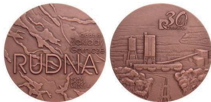
Rys. 37. Medal 30-lecia Zakładów Górniczych Rudna

Również kolejne dwa żetony zostały wyemitowane przez Zakłady Górnicze Rudna. Na awersie pierwszego z nich (rys. 40) przedstawiono rysunek zabudowań kopalni, poniżej napis: ZAKŁADY GÓRNICZE / RUDNA, przy krawędzi: KGHM POLSKA MIEDŹ S.A., na rewersie skrzyżowane młotki górnicze otoczone splecionymi gałązkami, nad nimi logo i nazwę KGHM, w otoku: NIECH ŻYJE NAM GÓRNICZY STAN (średnica 28 mm).