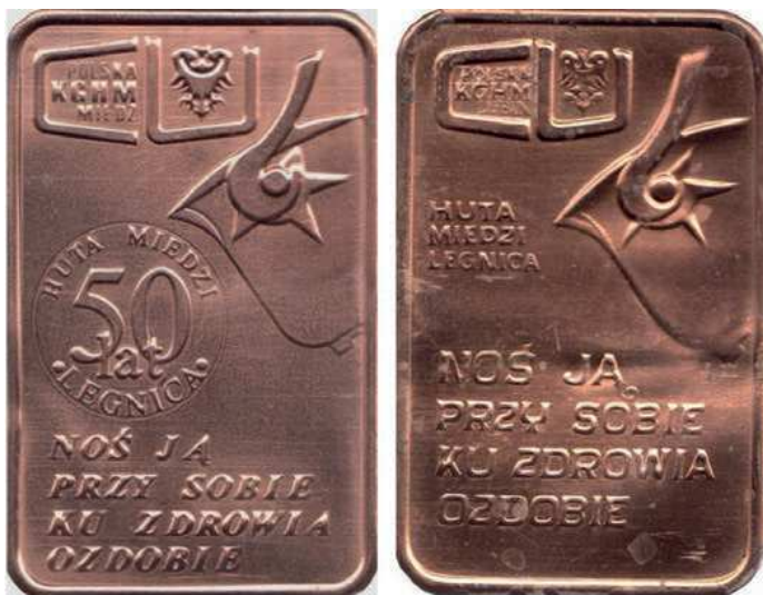
Rys. 54. Plakietki Huty Miedzi Legnica