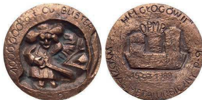
Rys. 49. Medal upamiętniający 1 mln ton miedzi z Huty Miedzi Głogów II

Z 1989 r. pochodzi medal odlewany, upamiętniający 1 mln ton miedzi z Huty Miedzi Głogów II (rys. 49). Na awersie postać hutnika przy pracy, u góry przy krawędzi napisano: 1000000 a t Cu BLISTER. Na rewersie widnieje napis: OPMB / 15.07.1989, przy krawędzi: HM "GŁOGÓW II" / WYDZIAŁ METALURGICZNY P-9. Średnica medalu wynosi 97 mm, grubość ok. 15 mm.