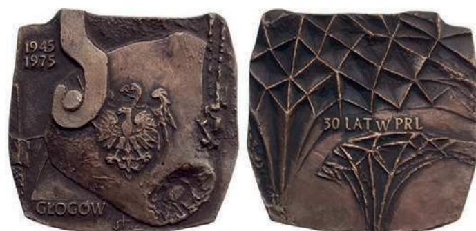
Rys. 45. Medal 30-lecia Głogowa

W 1975 r. został wykonany medal Głogowa (rys. 45). Na awersie występuje fragment kadzi hutniczej, na niej orzeł ze współczesnego godła Polski na tle orła z godła historycznego. Z lewej strony widać u dołu napis: GŁOGÓW, u góry daty: 1945 / 1975, na rewersie na tle sklepienia sieciowego napis: 30 LAT W PRL. Autorem medalu jest Józef Stasiński. Medal ma kształt nieregularny o wymiarach zewnętrznych 105×105 mm.