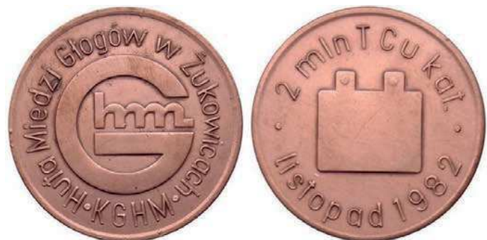
Rys. 46. Medal upamiętniający dwumilionową tonę miedzi z Huty Miedzi Głogów

Kolejny medal upamiętnia wyprodukowanie 16 listopada 1982 r. w Hucie Miedzi Głogów dwumilionowej tony miedzi (rys. 46). Na awersie znajduje się litera G, w niej wpisane litery hm. W otoku jest napis: Huta Miedzi Głogów w Żukowicach / KGHM. Na rewersie przedstawiono katodę miedzianą, w otoku znajdują się napisy: 2 mln T Cu kat. / listopad 1982. Średnica medalu wynosi 48 mm.