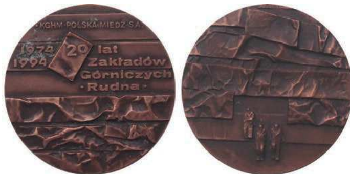
Rys. 34. Medal 20-lecia Zakładów Górniczych Rudna

W nakładzie 100 sztuk w tombaku srebrzonym i oksydowanym oraz 200 sztuk tombaku oksydowanym wybiła Mennica Państwowa (średnica 70 mm).