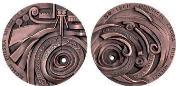
Rys. 10. Medal 50-lecia odkrycia złóż miedzi