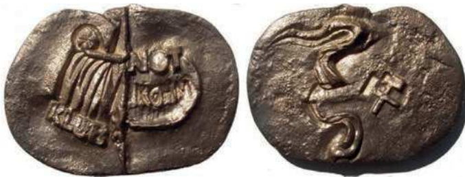
Rys. 21. Medal Klubu NOT KGHM

W 1980 r. Stowarzyszenie Inżynierów i Techników Górnictwa w Lubinie wydało medal Klubu NOT KGHM (rys. 21). Na awersie znalazł się stylizowany orzeł, pod lewym skrzydłem napis: KLUB, na prawym: NOT / KGHM. Na rewersie skrzyżowane młotki górnicze i faliste ornamenty. Medal został odlany z mosiądzu, wymiary to 95×63 mm.