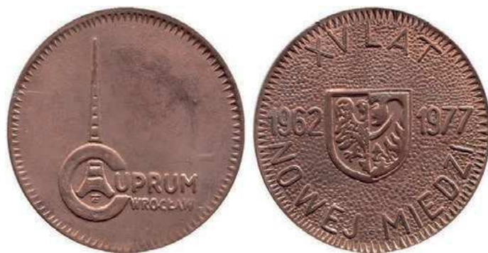
Rys. 57. Medal 15-lecia Zakładów Badawczych i Projektowych Miedzi Cuprum

JEDNOSTKI BADAWCZE. Od 1962 r. działała Wielobranżowa Pracownia Projektowa, przekształcona następnie w Oddział Zamiejscowy Biura Projektów Bipromet w Katowicach oraz Stację Badawczo-Doświadczalną Górnictwa Oddział Zamiejscowy we Wrocławiu. Na tej bazie w 1967 r. utworzono Zakłady Badawcze i Projektowe Miedzi Cuprum. Ich zadaniem było zapewnienie obsługi badawczej i projektowej Lubińsko-Głogowskiego Zagłębia Miedziowego. Od 1 stycznia 1993 r. spółka funkcjonuje jako KGHM CUPRUM – Centrum Badawczo-Rozwojowe [3].