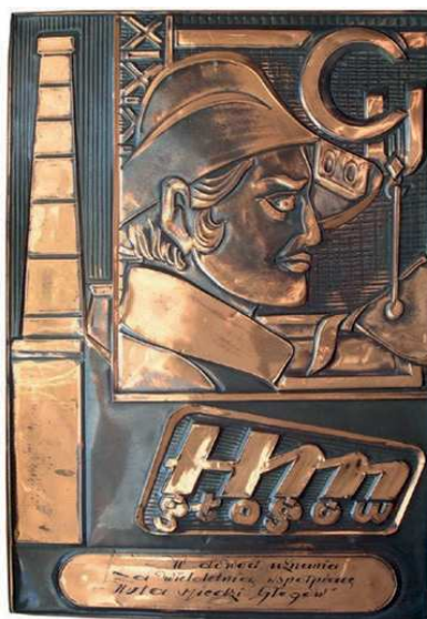
Rys. 52. Plaketka z podziękowaniem za pracę w Hucie Miedzi Głogów

Z podziękowaniem za pracę w Hucie Miedzi Głogów została wykonana plakieta z blachy miedzianej (rys. 52). Na plakiecie przedstawiono hutnika z profilem, u góry litery Cu, poniżej: HM Głogów. U dołu napis: W dowód uznania za wieloletnią współpracę Huta Miedzi „Głogów”. Wymiary plakiety to: 40x28,5 cm.