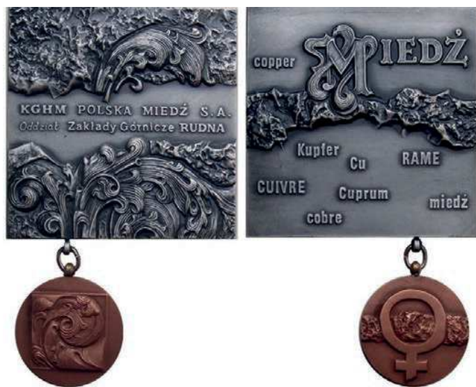
Rys. 35. Medal Oddział Zakłady Górnicze Rudna z 1997 r.

Jubileusz 20-lecia Zakładów Górniczych Rudna został upamiętniony medalem w 1994 r. (rys. 34). Na awersie, na tle poziomych pasów znajdują się napisy: KGHM POLSKA MIEDŹ S.A. / 1974 / 1994 / 20 lat / Zakładów / Górniczych / Rudna. Na rewersie przedstawiono warstwy pokładów miedzi, u dołu sylwetki trzech górników. Autorką projektu jest Hanna Jelonek.