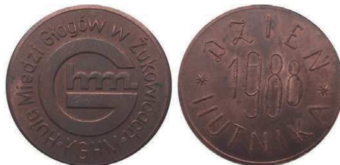
Rys. 47. Medal Huty Miedzi Głogów z okazji Dnia Hutnika 1988

W latach 1988 i 1990 zostały wydane medale z identycznym awersiem i napisem DZIEŃ HUTNIKA 1988 (1990) na rewersie (rys. 47, 48).