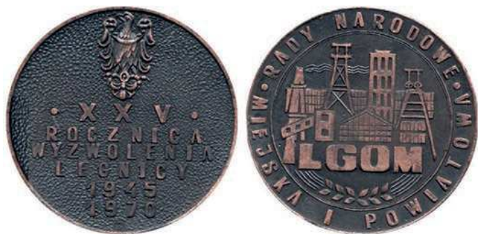
Rys. 55. Medal 25-lecia wyzwolenia Legnicy

na rewersie zabudowania miejskie i przemysłowe, poniżej napis: LGOM (Legnicko-Głogowski Okręg Miedziowy), w otoku: RADY NARODOWE / MIEJSKA I POWIATOWA.