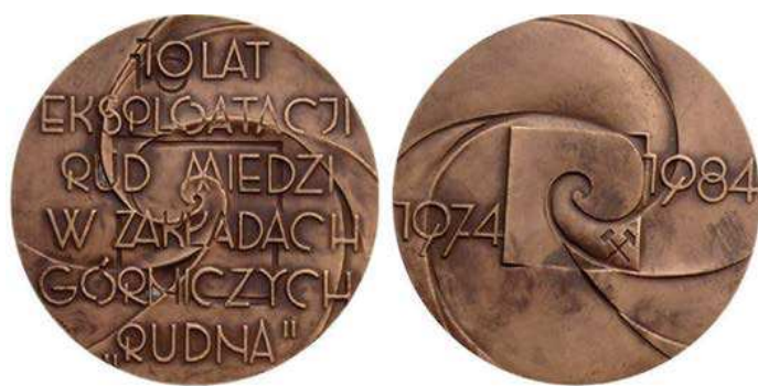
Rys. 33. Medal 10-lecia eksploatacji rud miedzi w Zakładach Górniczych Rudna

Ciekawy medal z przywieszką wyemitował KGHM Polska Miedź. Zakład Górniczy Rudna w 1997 r. (rys. 35). W górnej i dolnej części awersu znajduje się fakturowana powierzchnia jak ruda miedzi, ozdobiona fantazyjnym ornamentem. W środkowej części na gładkiej powierzchni zamieszczono napis: KGHM POLSKA MIEDŹ S.A. / Oddział Zakłady Górnicze RUDNA. Na rewersie w środku jest poziomy pas fakturowany jak ruda miedzi, powyżej i poniżej na gładkiej powierzchni napisy: MIEDŹ / copper / Kupfer / Cu / RAME / CUIVRE / Cuprum / miedź / cobre. Na awersie przywieszki znalazł się kwadrat ze stylizowanym logo ZG Rudna. Na rewersie na tle pasa fakturowanego jak ruda miedzi alchemiczny znak miedzi. Medal zaprojektowała i wykonała Hanna Jelonek. Medal wybito z tombaku srebrzonego i oksydowanego w kształcie kwadratu o boku 65 mm, okrągłą przywieszkę o średnicy 30 mm wykonano z miedzi. W nakładzie 200 sztuk wybiła go Mennica Państwowa (tombak patynowany).