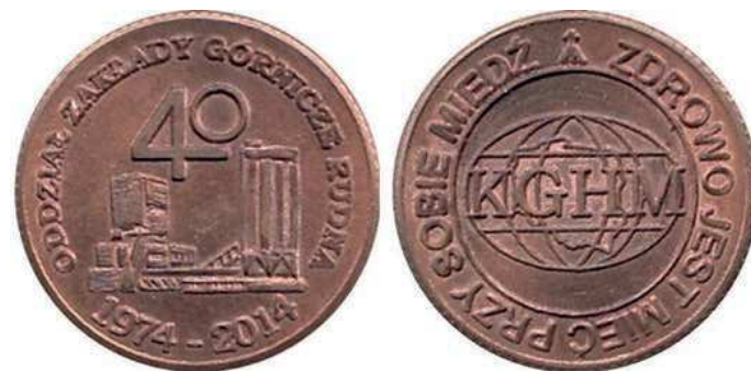
Rys. 39. Żeton 40-lecia Zakładów Górniczych Rudna

W 2004 r. został wyemitowany medal z okazji 30-lecia Zakładów Górniczych Rudna (rys. 37). Na awersie na fakturowanej powierzchni znajdują się napisy: Oddział / Zakłady Górnicze / RUDNA / KGHM / POLSKA / MIEDŹ S.A. Na rewersie pokazano widok na kopalnię, powyżej logo kopalni i napis: 30 lat / RUDNA. Medal zaprojektował i wykonał Artur Bochniak, średnica to 70 mm. Został wybity w Mennicy Polskiej w nakładzie 1000 sztuk w miedzi patynowanej.