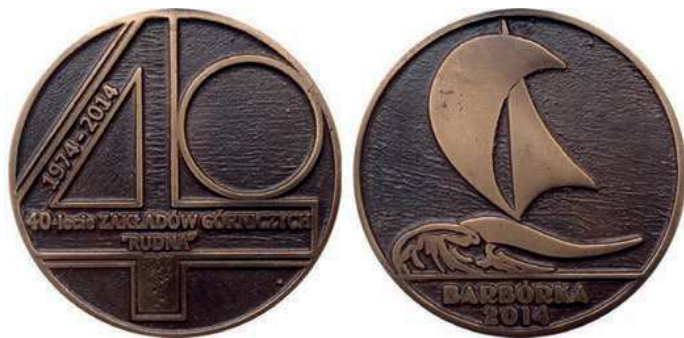
Rys. 38. Medal 40-lecia Zakładów Górniczych Rudna

W 1999 r. został wyemitowany medal z okazji 25-lecia Zakładów Górniczych Rudna (rys. 36). Na awersie przedstawiono złożę rudy miedzi ze skamienielinami oraz napisy: KGHM / POLSKA / MIEDŹ S.A. / ODDZIAŁ / ZAKŁADY / GÓRNICZE / RUDNA / 1974–1999. Na rewersie umieszczono rysunek stylizowanego chodnika kopalni, z prawej strony liczbę 25 pomiędzy cyframi logo ZG Rudna, na dole sylwetki trzech górników. Medal zaprojektowała Hanna Jelonek. W miedzi w nakładzie 3000 sztuk wybiła go Mennica Państwowa. Kształt medalu jest nieregularny, wymiary zewnętrzne to 70×68 mm.