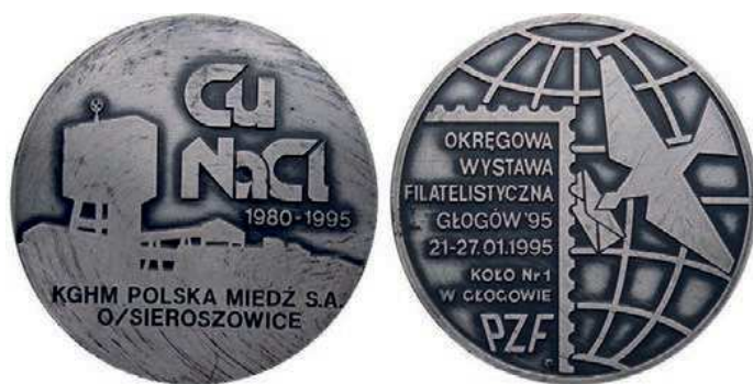
Rys. 43. Medal 15-lecia KGHM Polska Miedź Oddział Sieroszowice

1 stycznia 1996 r. w wyniku połączenia działających wcześniej kopalni Polkowice oraz Sieroszowice [2]. W 1995 r. został wydany medal z okazji 15-lecia KGHM Polska Miedź Oddział Sieroszowice i Wystawy Filatelistycznej Głogów'95 (rys. 43). Na awersie przedstawiono kontur zabudowy kopalni, z prawej strony stylizowane napisy: Cu / NaCl, pod nimi daty: 1980–1995, w dolnej części widnieje napis: KGHM POLSKA MIEDŹ S.A. / O/ SIEROSZOWICE. Z prawej strony rewersu na tle siatki geograficznej gołąb z dziobem. W lewej dolnej części w fragmencie znaczka pocztowego napis: OKRĘGOWA / WYSTAWA / FILATELISTYCZNA / GŁOGÓW '95 / 21.27.01.1995 / KOŁO Nr 1 / W GŁOGOWIE / PZF. Medal wykonał Robert Kotowicz. Średnica wynosi 55 mm. W nakładzie 200 sztuk w tombaku srebrzonym i oksydowanym wybiła go Mennica Państwowa.