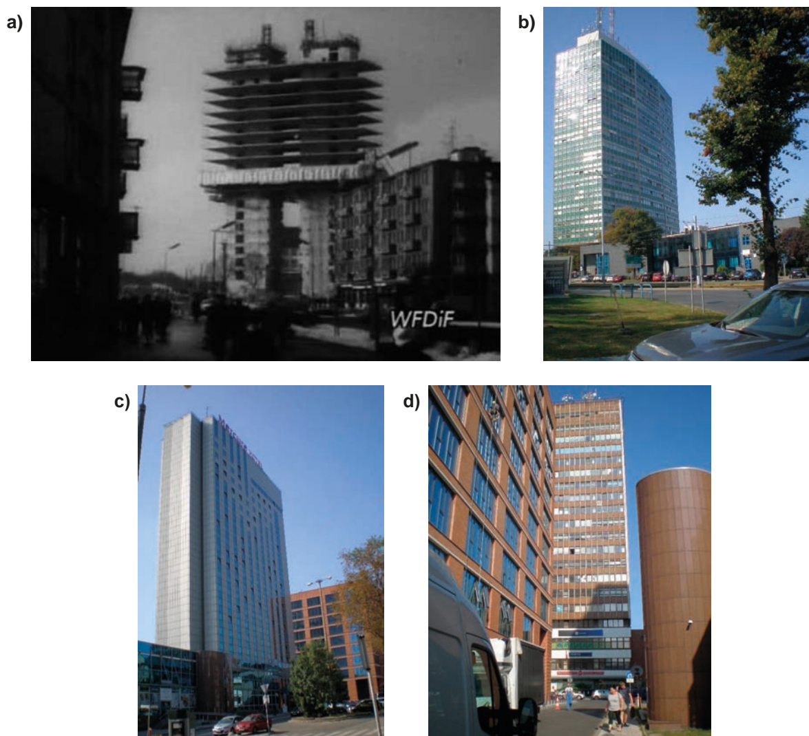
Rys. 2. Widok punktowców w Gdańsku

a) budynek Centrum Techniki Okrętowej „Zieleniak” (72,0 m) na etapie budowy w technologii „trzonolinowej”, 1971 rok, [25], b) elewacje „Zieleniaka” od strony południowo-wschodniej, c) Hotel Mercure „Hevelius” (70 m) i d) w głębi biurowiec „PROREM” (Organika) w Gdańsku przy ul. Rajskiej, (80 m), (fot. własne, wrzesień 2019 rok)