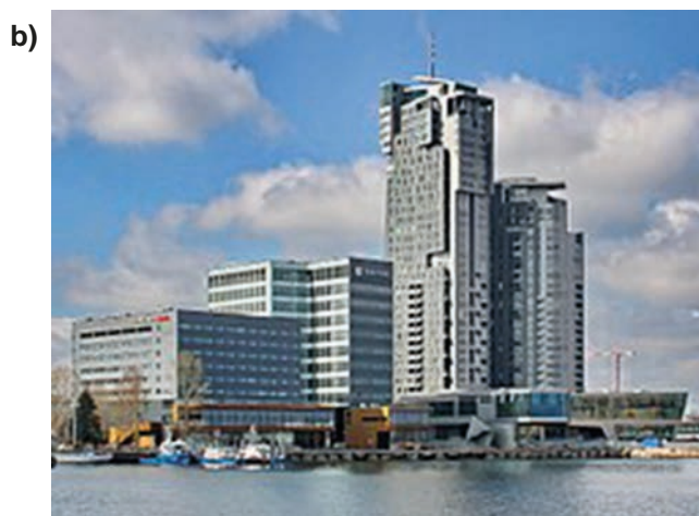
Rys. 5. Widok dwuwieżowego wysokościowca „Sea Towers” (125,50 m bez iglicy) w Gdyni a) w czasie budowy, od strony lądu oraz b) po zakończeniu budowy, od strony wody, 2018 rok [34]