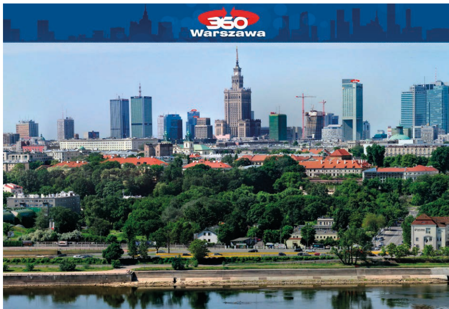
Rys. 1. Fragment panoramy Warszawy – Pałac Nauki i Kultury otoczony punktowcami