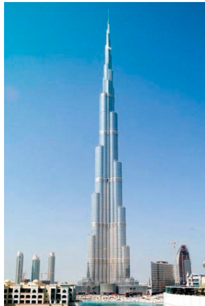
Rys. 6. Najwyższe budynki

a) w Europie w Sankt-Petersburgu „Łachta Centr” 462 m, 2018 rok (strona wiki łachta centr) oraz b) w świecie w Dubaju „Burj Khalifa” 828 m, 2009 rok [26]