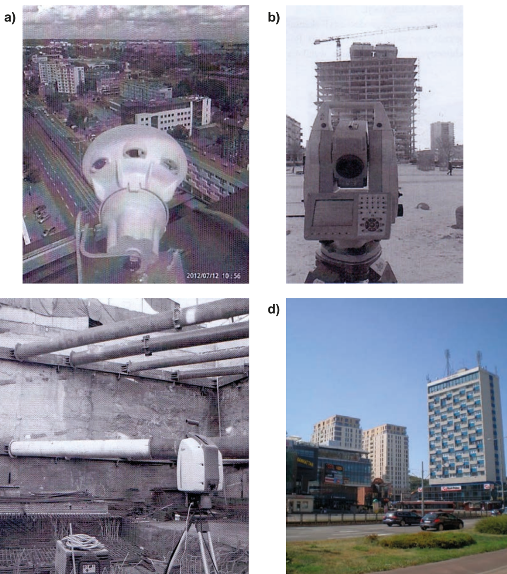
Rys. 3. Widok wysokościowców w Gdańsku – Wrzeszczu przy al. Grunwaldzkiej

W Polsce do dzisiaj palmę pierwszeństwa najwyższego budynku (o charakterze biurowo-usługowym i potrzeb kultury) dzierży 42-piętrowy Pałac Kultury i Nauki w Warszawie o względnej wysokości całkowitej 237 m (wysokościowiec) i wysokości do dachu 187,68 m. Obiekt o architekturze w stylu art déco wzorowany na wznoszonych w Stanach Zjednoczonych drapaczach chmur zbudowano w latach 1952-1956 (rys. 1). Pierwsze budynki w takim stylu wzniesiono w Nowym Jorku w latach trzydziestych XX wieku. W latach sześćdziesiątych/siedemdziesiątych i późniejszych XX wieku, przy zastosowaniu różnych technologii na obszarze całego kraju, zbudowano bardzo dużo budynków wysokich (o wysokości powyżej 25 m) i wysokościowych (o wysokości powyżej 55 m). Były to obiekty budowlane głównie o przeznaczeniu mieszkalnym i biurowym (w tym akademiki, hotele, biura projektów). Również w Trójmieście postawiono stosunkowo dużo budynków wysokich i wysokościowych znacznie wyższych niż 55 m. Na rys. 1 do 5 pokazano kilka przykładów, między innymi w różnych fazach budowy