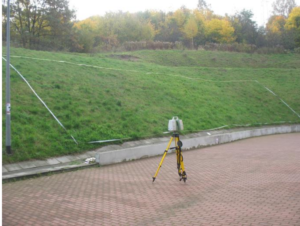
Rys.1. Obiekt pomiaru