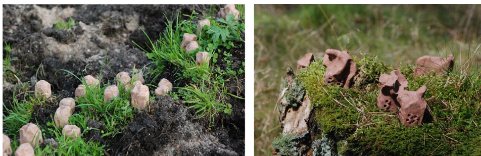
Ryc. 14. Wybrane przykłady według klasyfikacji pod kątem zindywidualizowania formy obiektów rzeźbiarskich (kolejno: typ „A”, typ „B”)

Drugi podział uwzględnia różne podejścia twórcze w metodzie. Można więc podzielić dotychczasowe efekty na dwie grupy: rozwiązania uzyskane poprzez formy schematyczne i te, w których zespół form to grupa rzeźb nieidentycznych, o unikalnym kształcie, ale stanowiących zbiór o jednorodnym charakterze formalnym (ryc. 14).