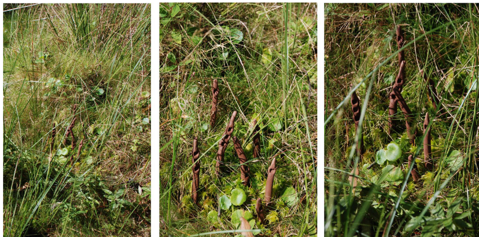
Ryc. 9. Wtopienie w otoczenie III