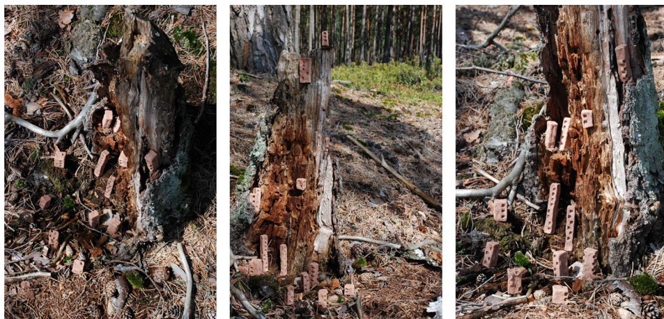
Ryc. 16. Lokowanie form schematycznych („A”) II