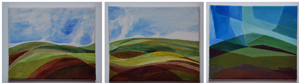
Ryc. 3. Wybrany przykład malarstwa plenerowego – element analizy, Joniny Wielkie 2020