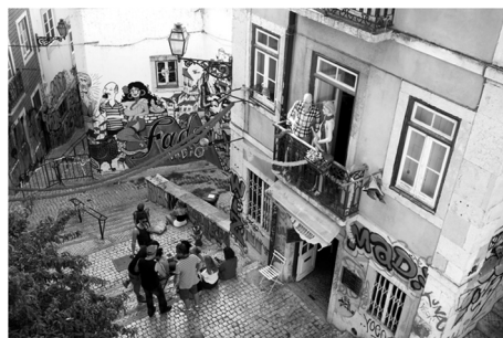
Fot. 2. Uliczki dzielnicy często przyjmują formę schodów. Mouraria, widok z Largo São Cristóvão w kierunku Travesa da Madalena

Początki dzielnicy sięgają XII w. Nazwa dzielnicy wywodzi się z faktu przesiedlenia na ten obszar populacji Maurów po zdobyciu miasta przez chrześcijan. W wyniku tych działań przesiedleńczych, na wzgórzu wokół zamku wytworzyła się struktura miejska o specyficznych cechach i typie zabudowy. Budynki usytuowane są na nieregularnej siatce odpowiadającej morfologii terenu. Charakterystyczna jest instensywna zwarta zabudowa przepleciona gęstą siecią wąskich uliczek, które ze względu na duże różnice wysokości często przyjmują formę schodów (fot. 2). Dzielnica jest kojarzona z klasą robotniczą i bogatą historią ruchów migracyjnych, będących nieodłączną częścią dziedzictwa multikulturowej Lizbony. Naznaczona jest jednak