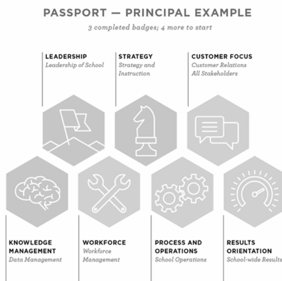
Rys. 1. Strona organizacji Matchbook – zdjęcie pokazujące przykładowe odznaki http://www.matchbooklearning.com/methodology/badges

tekstylnych naszywek, także ich cyfrowe odpowiedniki nadawane mogą być przez uprawnione instytucje osobom posiadającym szczególne umiejętności lub zasługi. Ich cyfrowa natura stwarza jednak dodatkowe możliwości, które mogą być wykorzystane w procesie edukacyjnym. Nic dziwnego zatem, że w kolejnych latach wiele różnych instytucji, szczególnie w Stanach Zjednoczonych i Wielkiej Brytanii, w tym także szkoły wyższe, zaczęły wykorzystywać nowy standard na swoich kursach, głównie e-learningowych, skierowanych do regularnych studentów i osób pragnących zdobyć dodatkowe wykształcenie. Niektórzy twórcy platform do prowadzenia zajęć online także udostępnili swoim użytkownikom nową funkcjonalność w postaci odznak potwierdzających ukończenie przez kursantów kolejnych etapów programów e-learningowych.