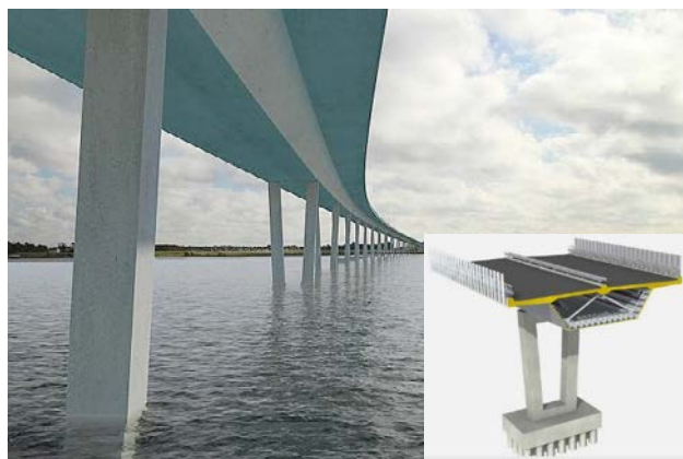
Rys. 1. Wizualizacja konstrukcji mostu – projekt Fjord Link Frederikssund, Dania