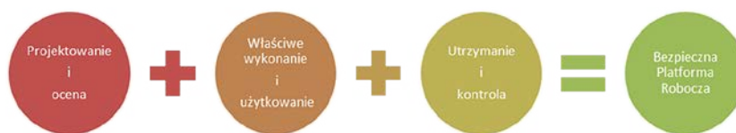
Rys. 1. Czynniki mające wpływ na jakość platformy roboczej [15]