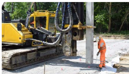
Fot. 2. Platforma robocza z tłucznia na geotkaninie

Zasady wymiarowania geosyntetyków w zależności od pełnionych przez nie funkcji opisano w poszczególnych częściach wytycznych ISO/TR 18228 Design using geosynthetics [10]. W zamierzeniach twórców opracowania te mają wspierać geotechników i inżynierów budownictwa w zakresie projektowania konstrukcji z użyciem geosyntetyków w budowach ziemnych i podziemnych, w których wyroby syntetyczne pracują w kontakcie z gruntami naturalnymi, nasypowymi i asfaltem. Są to nowe wytyczne, opracowywane w latach 2017-2022, dlatego opisane w dalszej części artykułu wcześniej opracowane metody projektowania platform roboczych z zastosowaniem geosyntetyków nie uwzględniają części informacji zawartych w [10].