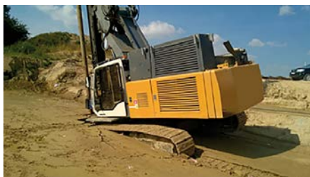
Fot. 1. Wjazd na podłoże po opadach deszczu [10]