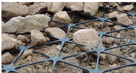
Fot. 3. Geosurt Tensor TriAx® – stabilizacja poprzez klinowanie [Tensor Polska Sp. z o.o.]