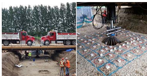
Fot. 4. Kalibracja metody T-Value – Saskatchewan 2019 [11]