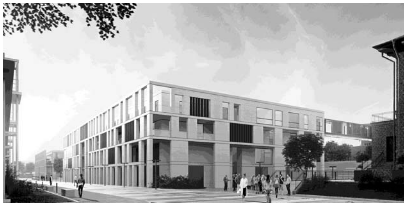
Ryc. 4. Centrum Ekoinnowacji Politechniki Gdańskiej

Budynek Centrum Ekoinnowacji Politechniki Gdańskiej jest twórczą kontynuacją przyjętych wcześniej rozwiązań, uwzględniającą w sposób możliwie najpełniejszy następujący w okresie dzielącym oba dzieła rozwój współczesnej myśli architektonicznej oraz rozwój techniczny i technologiczny, ze szczególnym uwzględnieniem rozwiązań proekologicznych i mających swe źródła w filozofii rozwoju zrównoważonego (ryc. 4). Intencją autora było również to, aby przez skalę budynku Centrum Ekoinnowacji oraz poprzez artykulację jego fasad stworzyć architektonicznie spójną i harmonijną kontynuację pierzei wschodniej ulicy Siedlickiej, zapoczątkowaną realizacją budynku Nanotechnologii „B”. Zachowanie ciągłości stylistycznej, porządkującej przestrzeń ulicy jest szczególnie ważne, zwłaszcza w kontekście bardzo niespójnej stylistycznie istniejącej architektury pierzei zachodniej.