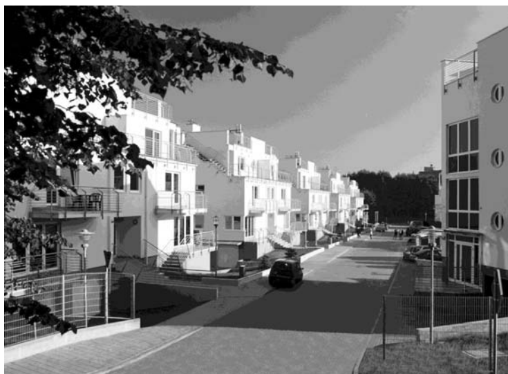
Fot. 2. Zespół zabudowy mieszkaniowej w Gdyni Orłowice

czas zachodzi możliwość realizacji zabudowy współczesnej. Stopień napięcia emocjonalnego związanego z projektowaniem i realizacją tego typu przedsięwzięcia sięga najwyższych poziomów twórczego zaangażowania. Architekt zmierzyć się tu musi nie tylko z niezwykle silnymi historycznymi i przestrzennymi uwarunkowaniami, skłaniającymi go do tworzenia kopii zabudowy historycznej, ale często również (głównie ze względu na wysokie oczekiwania społeczne wobec takiej architektury) z własnymi słabościami, przejawiającymi się najczęściej przemożną chęcią stworzenia czegoś naprawdę wyjątkowego, dorównującego, a najlepiej przewyższającego swą wartością istniejącą zabudowę historyczną. Kluczem do wyjścia z opresji nie jest naturalnie ani przesadne twórcze samoograniczenie i nadmierna skromność ani też ostentacyjny brak respektu dla zastanych wartości, ale ich dogłębne rozpoznanie i zrozumienie pozwalające na podjęcie prawidłowych decyzji projektowych. Nie powielanie, ale twórcze przetwarzanie wzorców i archetypów stanowić tu może pomost między historią a terażniejszością. Nie można robić użytku z pięknej architektury minionych epok, gdyż w nowych czasach, przy zmienionym sposobie życia, staje się ona nieprawdziwa i pretensjonalna [Rasmussen 2015: 13]. Najbardziej wartościowe dzieła powstają bowiem w wyniku stworzenia subtelnej równowagi – właściwej dla miejsca, czasu i zadania – pomiędzy tradycją miejscową a „importowanymi”, często-kroć nowymi ideami i technologiami 3 .