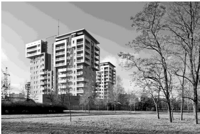
Fot. 1. Zespół mieszkaniowo-usługowy w osiedlu Gdańsk-Zaspa.

Autor: A. Taraszkiewicz z zespołem (fot. 1-4, ryc. 1-4)