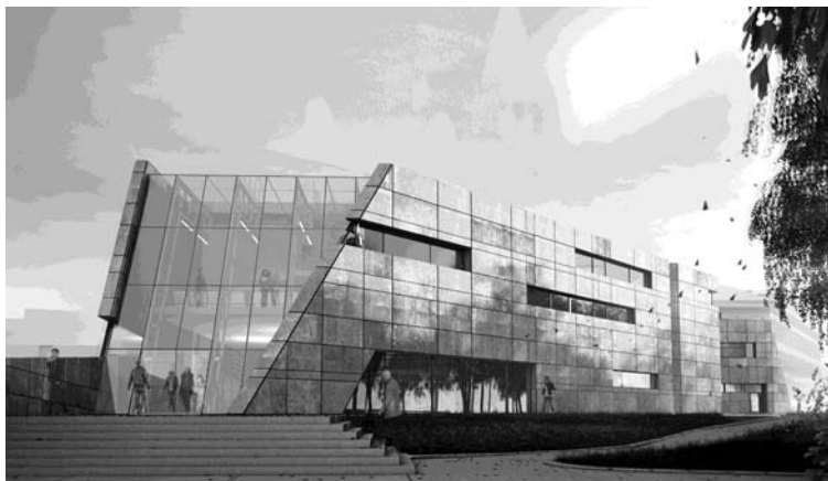
Ryc. 3. Centrum Dziedzictwa Historycznego Miasta Gdańska

Innym ważnym elementem w koncepcji CDHMG i starannie przemyślanym przez autorów projektu jest (zastosowana na fasadach, ale również i na dachu projektowanego budynku) zieleń spatynowanej miedzianej blachy. Ten szmaragdowy odcień zieleni wpisany jest immamentnie w koloryt „brązowo-ceglanego” (w swym ogólnym odbiorze) historycznego Gdańska, a występuje zawsze tam, gdzie architekt chciał podkreślić i wskazać wyjątkowy charakter, czasem niewielkiego skąd, ale niezwykle istotnego elementu. Zieleń ta pokrywa hełmy wszystkich gdańskich wież kościelnych i wież ratuszowych, zdobi kopułę Kaplicy Królewskiej i hełmy (bli-