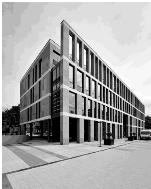
Fot. 4. Centrum Nanotechnologii „B” Politechniki Gdańskiej

się z otoczeniem kampusu Politechniki Gdańskiej, a jednocześnie materiału bardzo nowoczesnego, stosowanego współcześnie w wielu bardzo prestiżowych obiektach użyteczności publicznej. Zgodność koloru budynku Centrum Nanotechnologii „B” z kolorytem miejsca jego lokalizacji, z jednoczesnym zastosowaniem współczesnych, minimalistycznych rozwiązań architektonicznych, pozwoliło nowemu obiektowi stać się nierozdzielalną częścią otoczenia, a jednocześnie znakiem nowoczesności i postępu – bardzo pożądanym w nowoczesnym ośrodku naukowym.