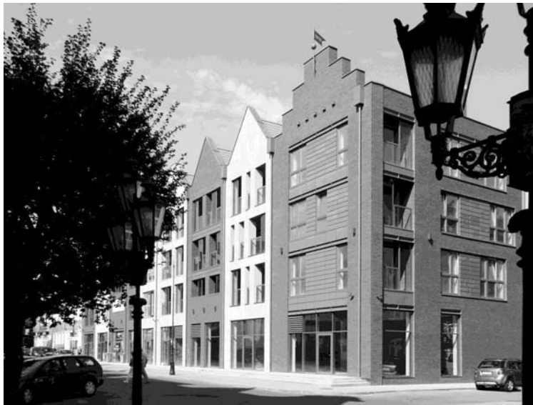
Fot. 3. Zespół zabudowy mieszkaniowo-usługowej w Gdańsku

Architektura kwartału, mimo że poprzez formę, skalę, proporcje oraz charakter bryły wyraźnie odnosi się do historycznej zabudowy Gdańska, to jednocześnie jest architekturą na wskroś współczesną, w której odniesienia historyczne w najmniejszym stopniu nie są ani bezpośrednimi przeniesieniami ani zapożyczeniami. O współczesnym wyrazie tej architektury decydują: charakterystyczny dla naszych czasów, czerpiący z dorobku stylu międzynarodowego sposób artykulacji fasad, „świeży” detal architektoniczny (np. minimalistyczne belki – nadproża wykonane z walcowanych ceowników) oraz zastosowane nowoczesne materiały i technologie budowlane np. blacha cynkowo-tytanowa wykorzystana, jako materiał elewacyjny. Poza ogólnym charakterem bryły kwartału, do elementów tworzących architekturę, która ma ambicję zyskania miana twórczości patrzącej w przyszłość, ale jednocześnie nie zapominającej o spuściźnie przeszłości, dołączyć należy jeszcze: usytuowaną na wewnętrznym dziedzińcu kwartału fontannę Neptuna (parafrazę słynnej gdańskiej fontanny stanowiącej symbol związków miasta z morzem), mur graniczny z płaskorzeźbą przedstawiającą uwspółcześnioną wersję historycznej panoramy miasta oraz wydobyte spod ziemi (w trakcie wykopalisk archeologicznych) i wyeksponowane w partech kamienic, gotyckie ściany ceglane.