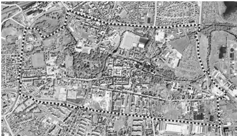
Ryc. 2. Granice i struktura obszaru rewitalizacji – do objęcia wsparciem działań rewitalizacyjnych ze środków regionalnego programu operacyjnego woj. pomorskiego