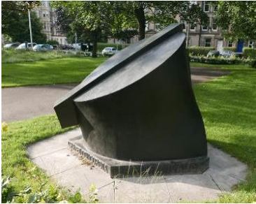
Fig. 3. Ankle

Ryc. 3. Kostka