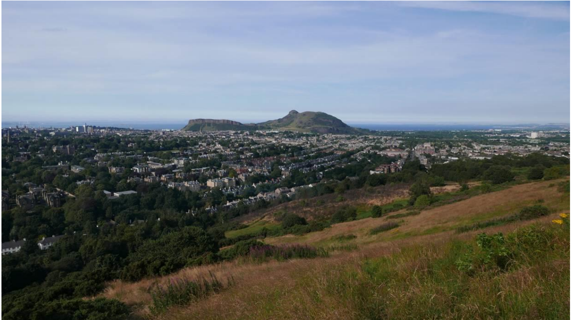
Fig. 1. Arthur's Seat Hill, south Edinburg view.

Ryc.1. Wzgórze Arthur Seat, Edynburg od strony południowej.