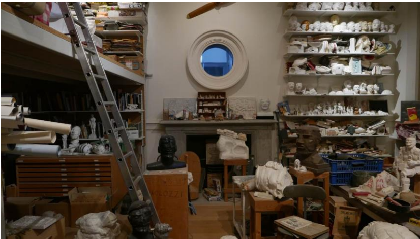
Fig. 6. Paolozzi studio at Scottish National Gallery of Modern Art Two.

Ryc. 5. Ręka.