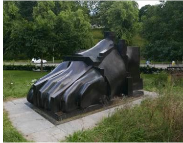
Fig. 4. Foot.

Ryc. 3. Kostka