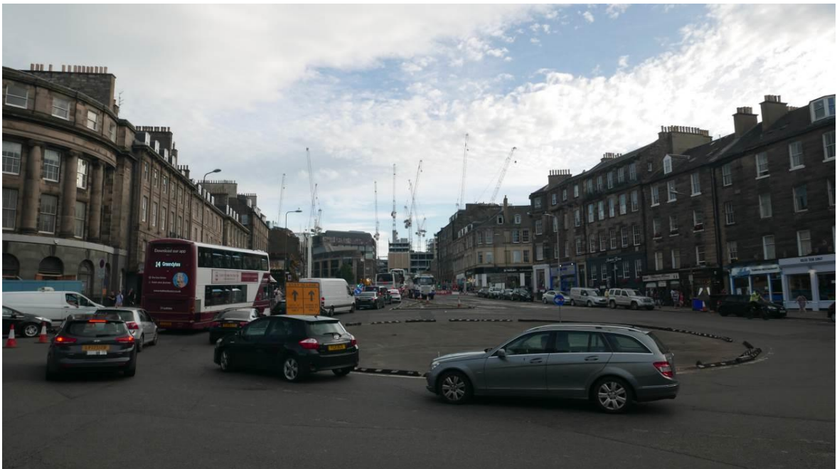
Fig. 2. Leith Walk – the view on revitalized St James Shopping Center.

Ryc.1. Wzgórze Arthur Seat, Edynburg od strony południowej.