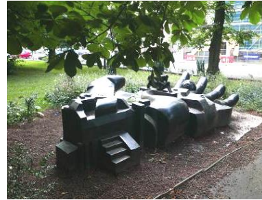
Fig. 5. Hand.

Ryc. 4. Stopa