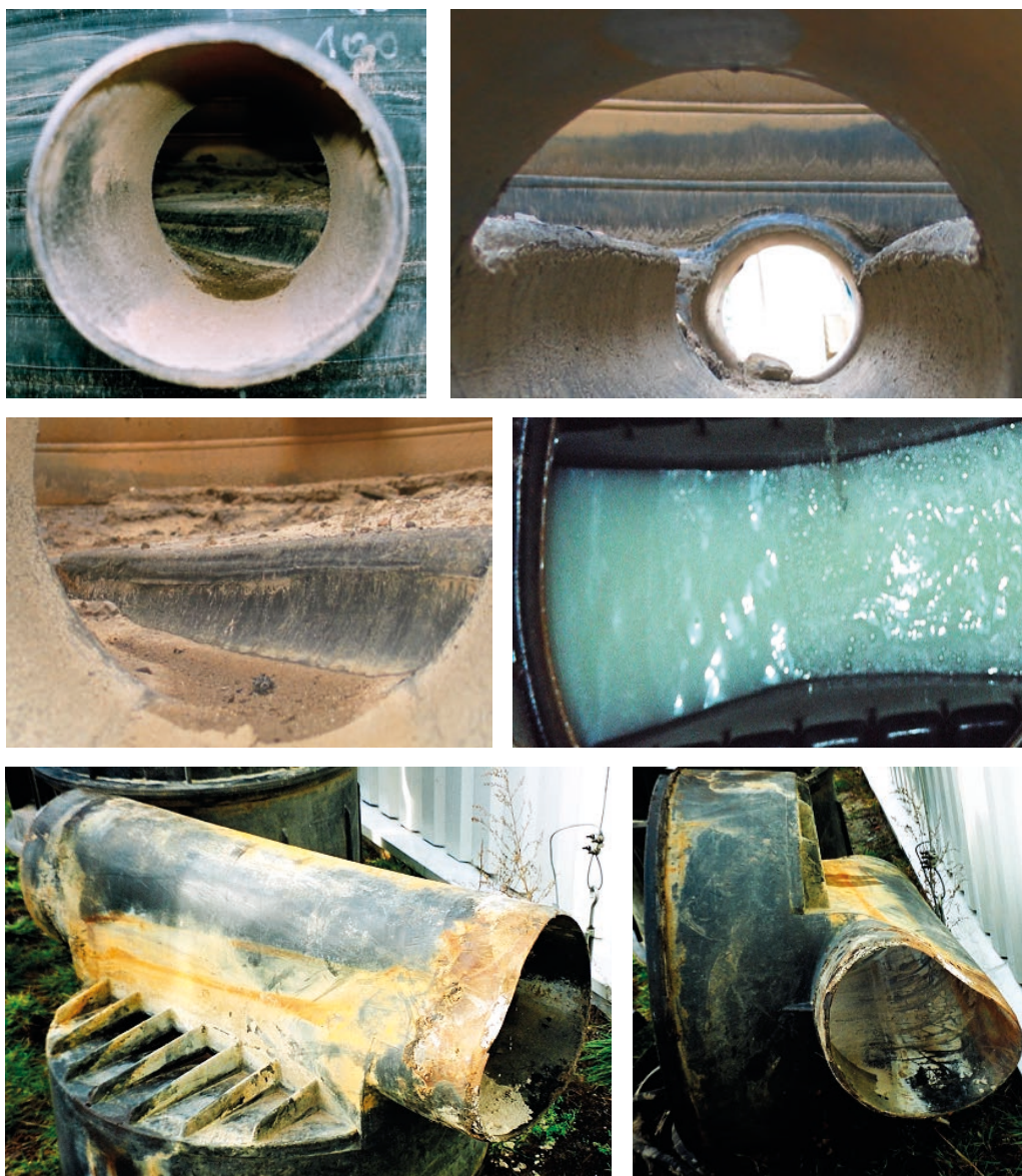
Rys. 2. Przykłady uszkodzeń i zniszczeń w wyniku nieodpowiedniego posadowienia obiektów kanalizacyjnych na przykładzie studzienek rewizyjnych