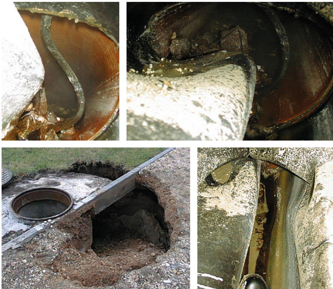
Rys. 3. Przykłady awarii w konsekwencji nieodpowiedniego posadowienia

kumentacji projektowej fazy projektu budowlanego dotyczącej inwestycji mieszczącej się w trybie zamówień publicznych [13] może pojawić się konkretny wyrób określonej firmy? Tu trzeba być bardzo ostrożnym, jednak bezwzględnie powinny być zdefiniowane minimalne wymagania, stąd szczególne znaczenie dokumentacji fazy projektu koncepcyjnego oraz Specyfikacji Istotnych Warunków Zamówienia.