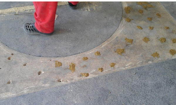
Fot. 4. Naprawa rys konstrukcyjnych i uzupełnienie ubytków po iniekcjach strukturalnych odtwarzających warstwę szczepną [M1]