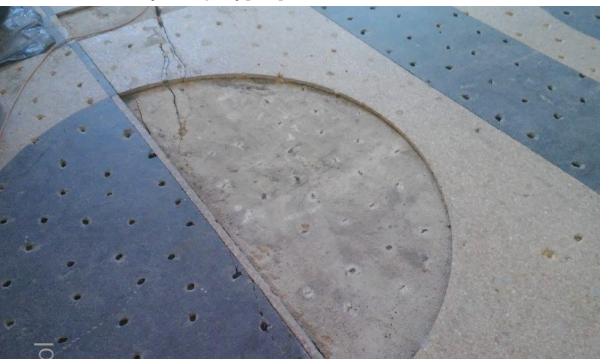
Fot. 3. Różnicowanie kolorystyczne oraz geometryczne naprawianej posadzki lastrico, widoczne fragmenty wymienianej i regenerowanej posadzki [M1]

strukcji. Rysy skurczowe ulegają znacznemu wypłyceciu w procesie szlifowania, a z uwagi na brak przesuwania krawędzi rys do ich wypełnienia stosuje się masy szpachlowe lub wyprawki na bazie kompozytów epoksydowo-kwarcowych z zastosowaniem żywic o zwiększonej lepkości w celu właściwej penetracji podłoża. Naprawa rys i spękań o charakterze konstrukcyjnym jest analogiczna jak przy naprawach zarysowanych płyt betonowych, z uwzględnieniem zasad wykonywania napraw strukturalnych w miejscach zarysowań wynikających z zapisów normy [N1–N4]. Istniejące pęknięcia należy poszerzyć mechanicznie oraz wykonać zgodnie z zasadami sztuki budowlanej nacięcia poprzeczne w celu uciążlenia poprzez kłamrowanie krawędzi rysy. Wszystkie bruzdy należy dokładnie odkurzyć, usuwając powstały pył zbie-