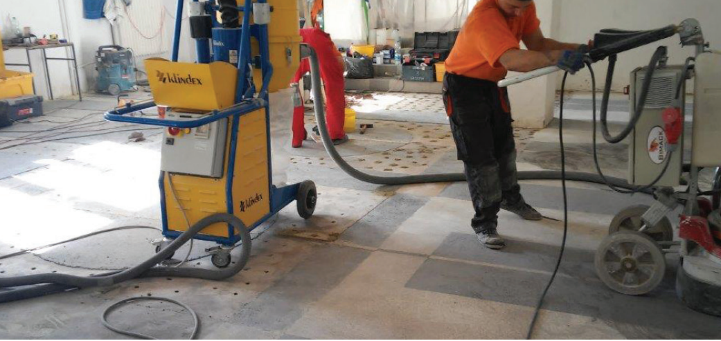
Fot. 3. Wstępne szlifowanie nawierzchni posadzki typu lastrico [M1]