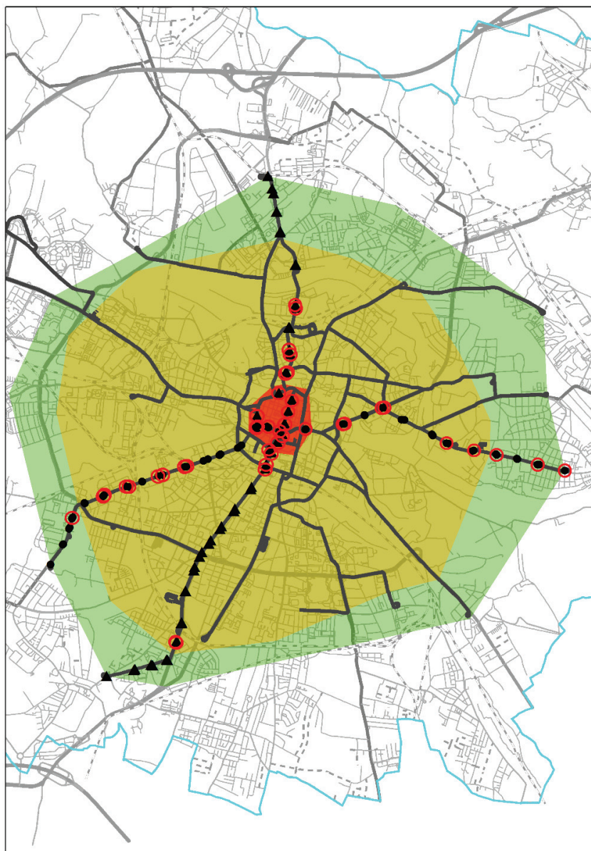
Fig. 1. Test results safety assessment of stops for tram lines 4 and 7

As part of the prepared assessment, it was assumed that the minimal level of the safety indicator is 20 points. Therefore, stops, whose safety index was 20 points or less were considered dangerous. Immediate improvement actions are required for these stops. These stops have been highlighted on the map (red spots) in fig. 1.