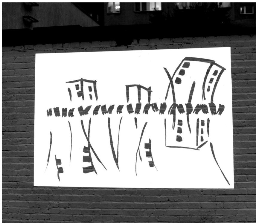
Ilustracja 3. Szkice ukazujące ideę działania pokazane w prezentacji multimedialnej

obszary porozumienia. Sugerują nieoczywiste a jednak zachodzące, uwidocznione i doświadczane relacje.