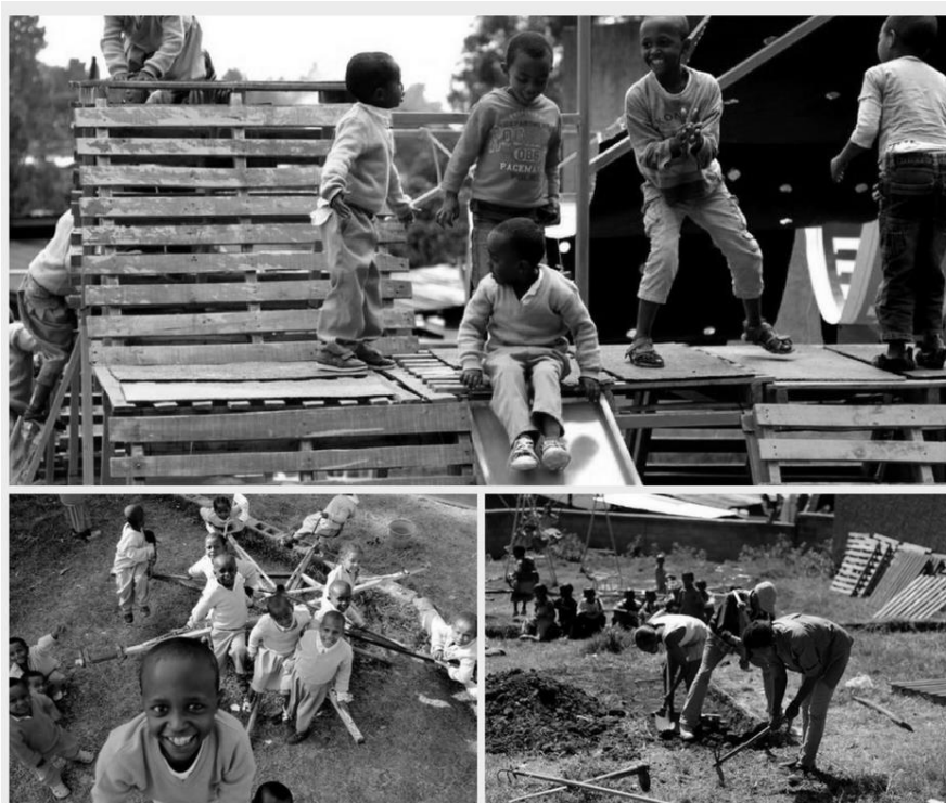
Rysunek 3. Plac zabaw zaprojektowany na terenie sierocińca w Etiopii.