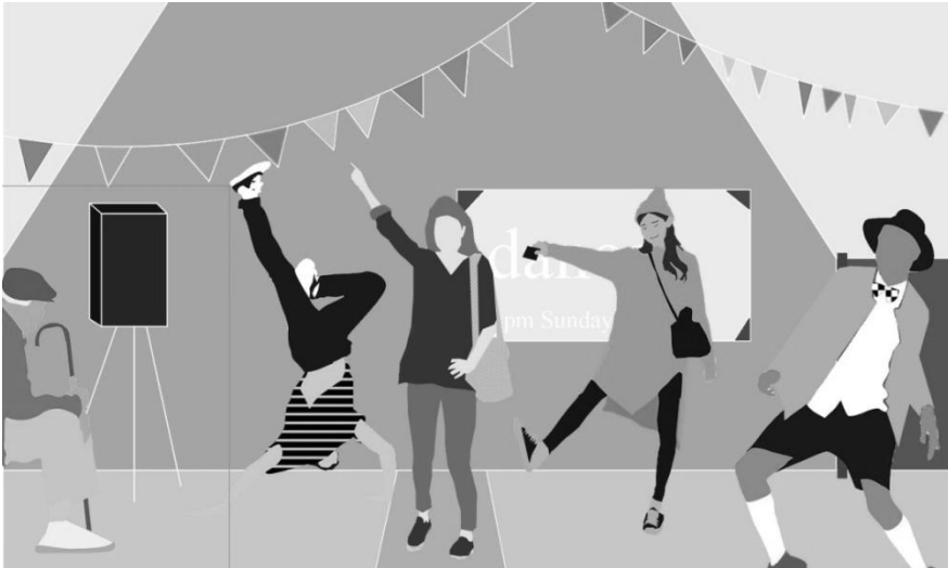
Rysunek 2. Inicjatywa taneczna Dance-O-Mat.

Projekt LQC stara się podejmować działania pomimo braku dostępnych środków na poprawę przestrzeni publicznej. Partycypacyjny i wspólnotowy charakter projektów to ostatni z czynników. Źródła finansowania mogą pochodzić z kampanii crowdsourcingowych, programów rządowych ukierunkowanych na działania kulturowe, prywatnych instytucji oraz fundacji, jak również firm usytuowanych w pobliżu działki.